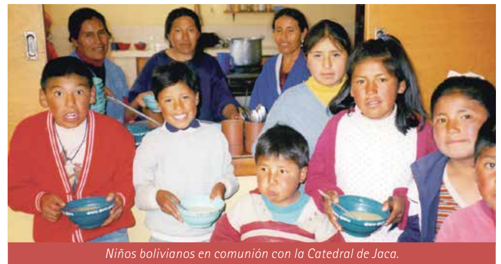
Niños bolivianos en comunión con la Catedral de Jaca.

Hoy domingo 15 de enero, Jornada Mundial de las Migraciones, la misa de las 13 horas de la S. I. Catedral de Jaca, se celebrará con esta intención. Los