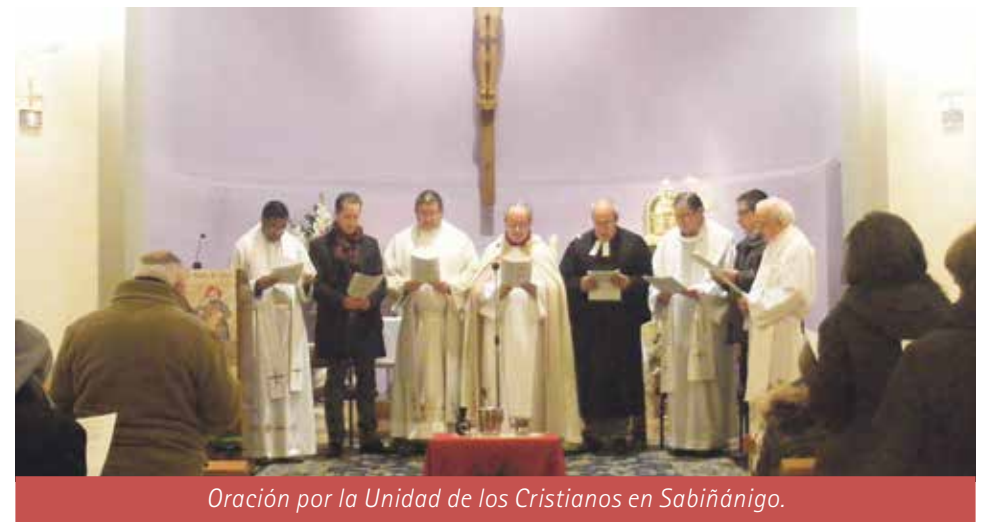
Oración por la Unidad de los Cristianos en Sabiñánigo.

El Equipo Ecuémico de Sabiñánigo ha preparado los siguientes actos y celebraciones para estos días con motivo de la Semana de ORación por la Unidad de los Cristianos: