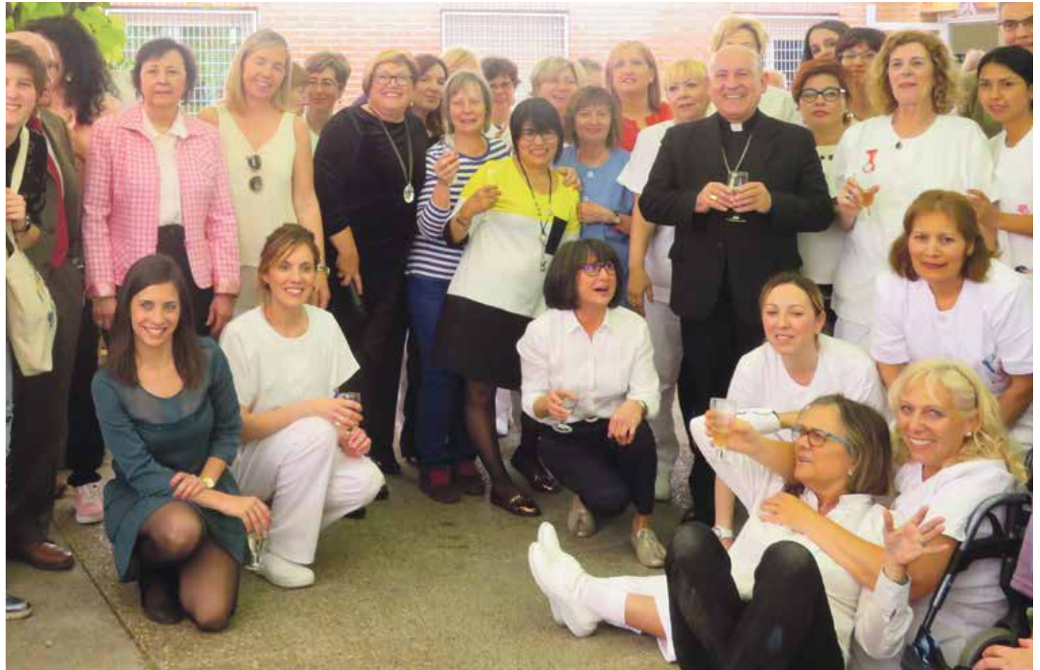
La residencia Santa Teresa, iniciativa de Cáritas en Zaragoza, está celebrando 25 años de asistencia a personas dependientes.

En unas jornadas recientes de las Cáritas de España se abordaba el reto de conseguir un modelo distinto de economía que se centre en la persona y no en el exclusivo beneficio de unos pocos. Una economía solidaria al servicio de los derechos humanos y el cuidado de la Creación. Desde el 2008 han empeorado las condiciones de vida de muchos: escenarios precarios, con condiciones laborales que antes de la crisis resultaban inadmisibles. Como dice el papa, hay que apostar por una economía que no mate a las personas.