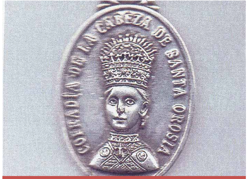
Medalla de la Cofradía de la Cabeza de Santa Orosia.