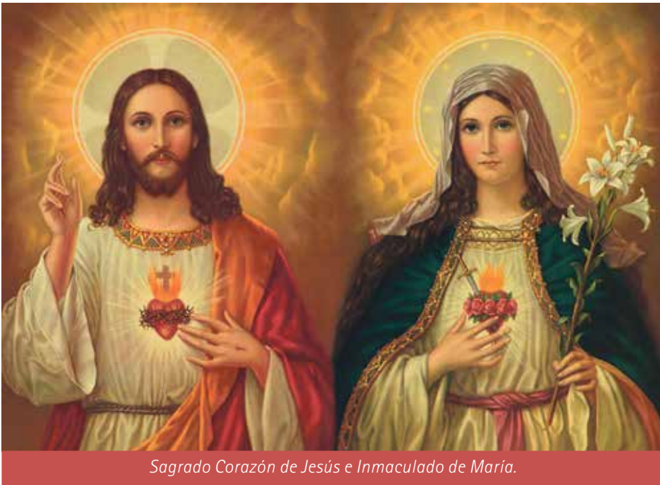
Sagrado Corazón de Jesús e Inmaculado de María.

Hace años era habitual que, en muchas casas, estuviera entronizada en sitio preferente una imagen del Sagrado Corazón de Jesús. Indicaba en quién confiaban sus moradores, a quién estaba consagrada la familia. No era una figura decorativa sin alma. La efigie de Jesús, bendiciendo y mostrando su pecho abierto, era en ese hogar personificación cordial del amor divino, manifestaba con claridad que Dios es amor. Como símbolo del cuerpo entero de quien es todo corazón, bastaba este órgano vital.