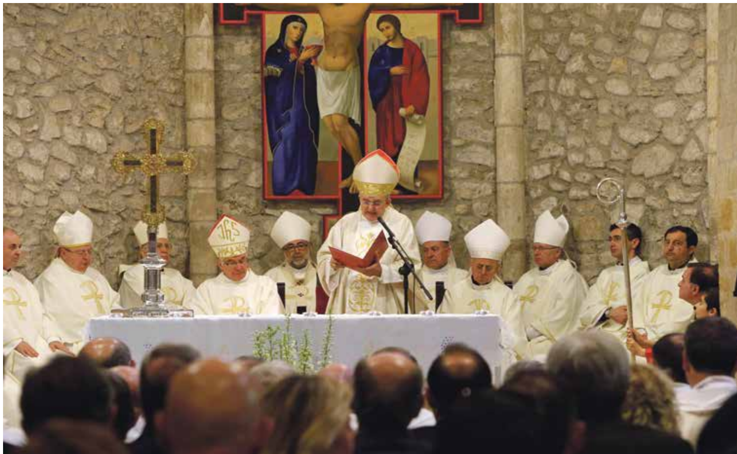
En la apertura del Año Santo Lebaniego estuvo presente el arzobispo de Zaragoza.

Dos trozos de la 'Vera Cruz', la verdadera cruz en la que Jesucristo consumó su ofrenda al Padre, meta de peregrinación y razón para celebrar en 2017 sendos años jubilares. En Liébana se celebra desde la Edad Moderna los años en que el 16 de abril, festividad de Santo Toribio, cae en domingo. En Caravaca, cada siete años desde 2013.