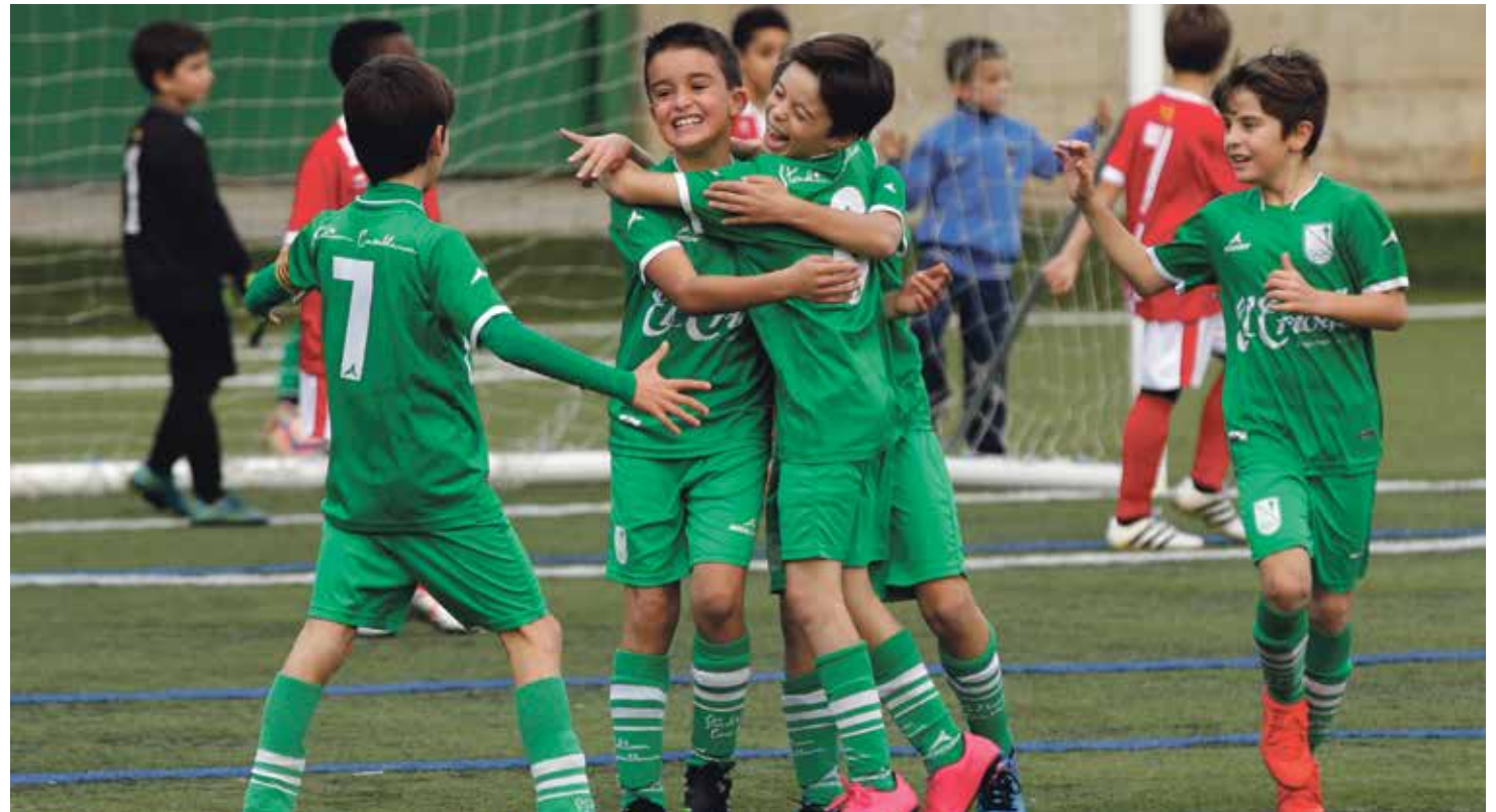
Fomentar los valores cristianos a través del deporte es la prioridad de los técnicos, por encima de los resultados.