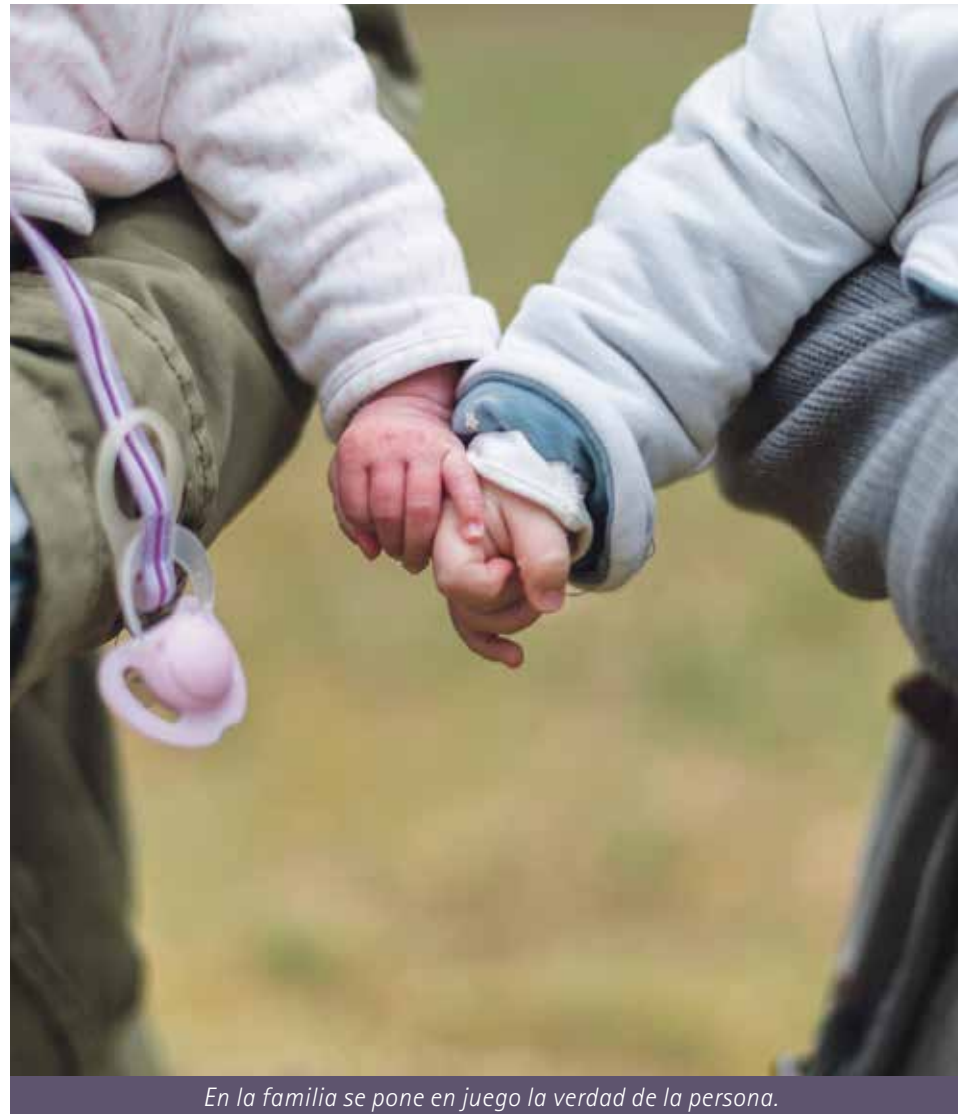
En la familia se pone en juego la verdad de la persona.

Si podemos decir que la persona humana no se realiza en la violencia, ni el desorden afectivo o que existen unos derechos humanos, es porque existe una verdad de fondo en el