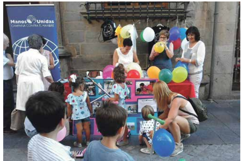
Mesa de Manos Unidas en el Ayuntamiento de Jaca.

Los pasados 22 de julio y 14 de agosto la delegación de Manos Unidas Jaca estuvo con una mesa en la calle Mayor, puerta del ayuntamiento para darnos a conocer sobre todo, lo que se sacó en ambos días sirve para sacar adelante el proyecto que este año estamos intentando "Desarrollo de la mujer y mejora en la educación de niños de Barrios Marginales" en la India.