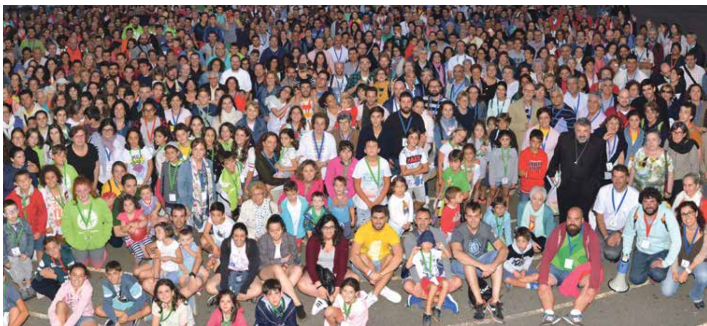
Foto de familia de los casi mil participantes en el Encuentro de Laicos de Parroquia.

La doble peregrinación a Fátima y Santiago, entre el 24 de julio y el 3 de agosto, les ha permitido vivir unidos el amor de Dios, soñar el futuro junto a más de 1.000 jóvenes de toda España y experimentar con intensidad la alegría de la fe.