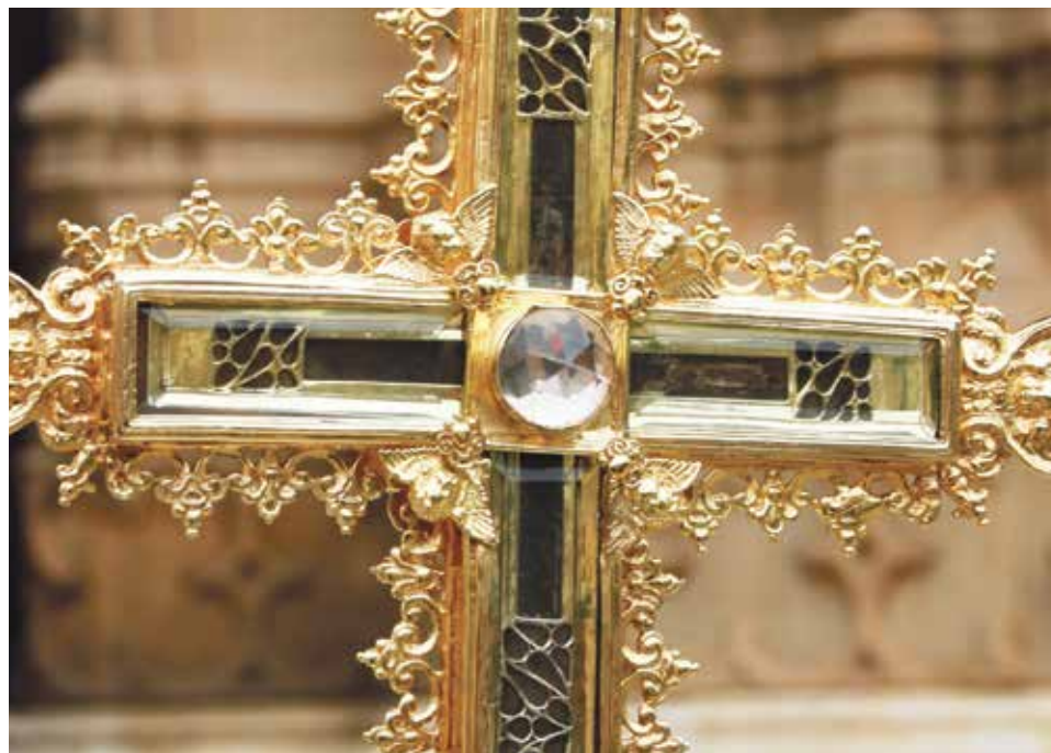
La Vera Cruz.

Levantada una capilla en la Iglesia Parroquial, en 1730, con la finalidad de dar culto en ella a la Vera Cruz, se traslada a su nueva residencia la