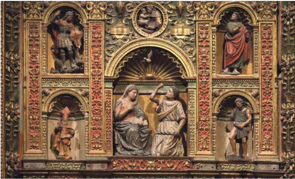
Retablo de la Anunciación. Catedral de Jaca.

Renacimiento. Siglo XVI. Escultura en madera policromada. Procede de la Catedral de Jaca.