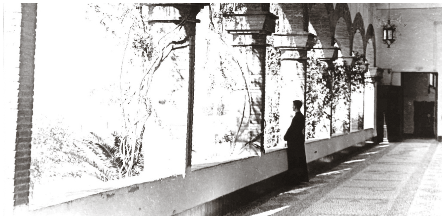
Imagen histórica de la 'Galería de la Obediencia' del Seminario de Málaga.