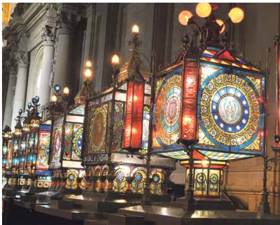
Faroles del Rosario del Cristal expuestos en la plaza del Pilar.

A partir de entonces, las celebraciones en honor de la Virgen se extienden por toda la ciudad, como es el caso de la iglesia parroquial de San Pablo que lidera la apertura del programa religioso del 12 de octubre, día festivo desde el año 1613, con ese Rosario de la Aurora que comienza a las cinco de la mañana y que ya recorría las calles camino de la basílica pilarista en el siglo XVIII. Cumplida la visita a la Virgen, retorna cantando a la insigne parroquia donde se celebra una misa aragonesa habitualmente interpretada por miembros de la Cofradía del Silencio.