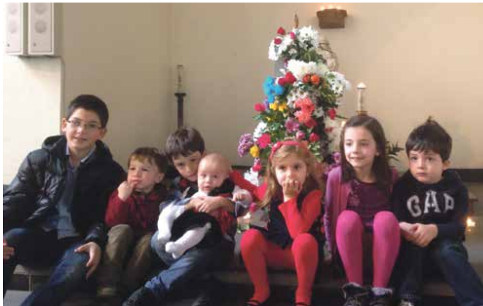
Niños aragoneses celebran la Virgen del Pilar en Londres.

El evento fue un éxito y ya es un clásico que se repite año tras año. Este grupo de aragoneses, españoles y devotos, se reúnen, celebran misa, hacen la tradicional ofrenda de flores