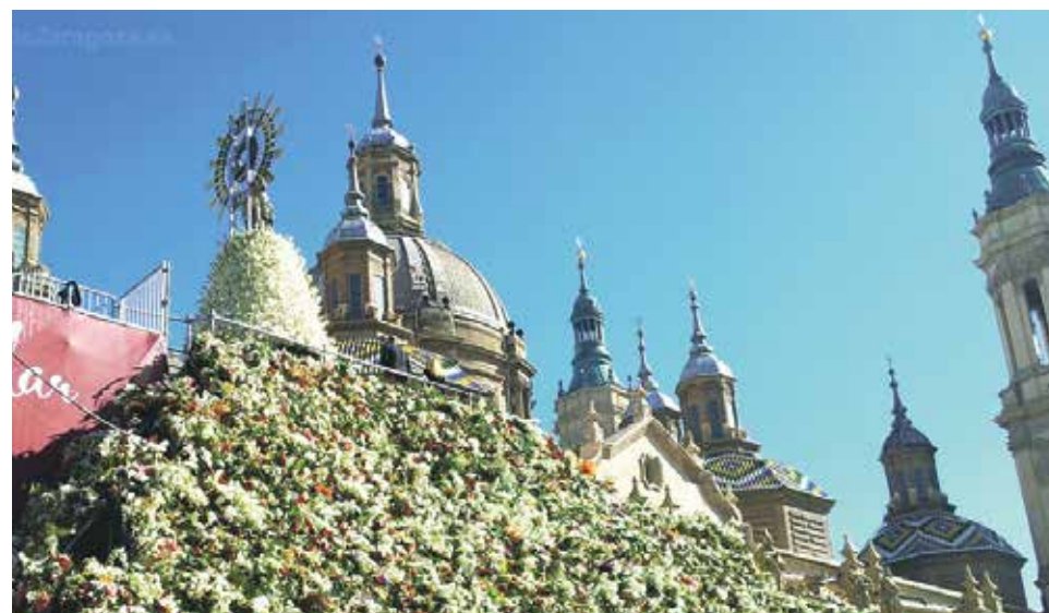
El Pilar y la Virgen tras la Ofrenda.

De nuevo se han batido este año récords de participación en la Ofrenda de Flores a la Virgen del Pilar del próximo 12 de octubre. En total son 704 los grupos inscritos, 20 más que el año pasado.