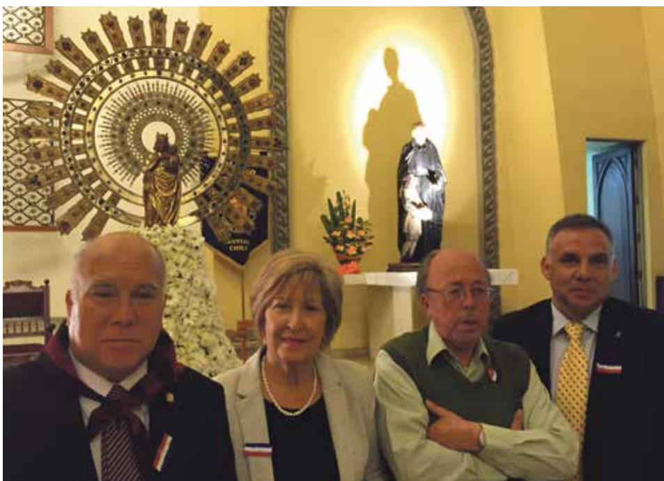
La Iglesia dedicada a la Virgen del Pilar en Santiago de Chile cumple 100 años.

El colegio fue creciendo (hoy tiene 1.100 alumnos) y la capilla se fue haciendo pequeña. Así, en 1948 se comenzó la actual construcción, inaugurada en 1953 tras cinco años de intenso trabajo. El título es oficioso, puesto que el fervor de los primeros religiosos puso el nombre de “Basílica” al templo, como en el caso del original de Zaragoza.