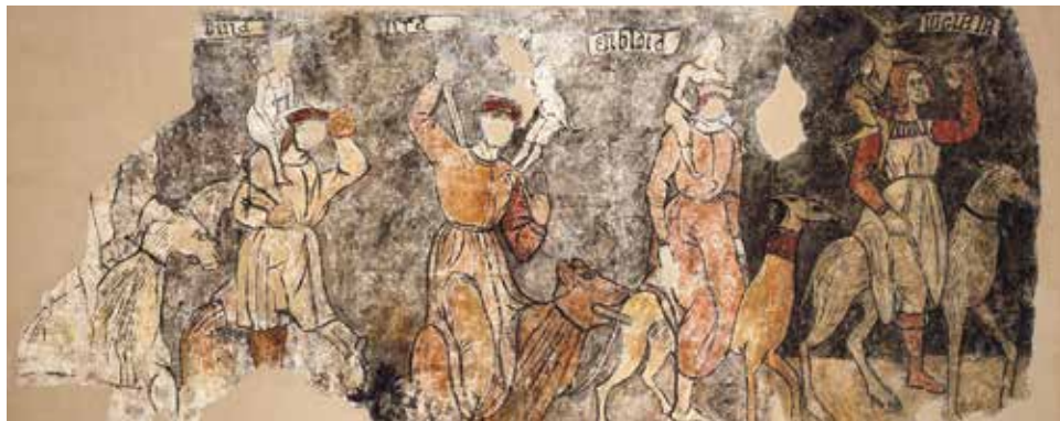
Los pecados capitales.

Pintura mural al temple arrancada y traspasada a lienzo. Procede de la iglesia de San Miguel de Sieso de Jaca. Siglo XVI.