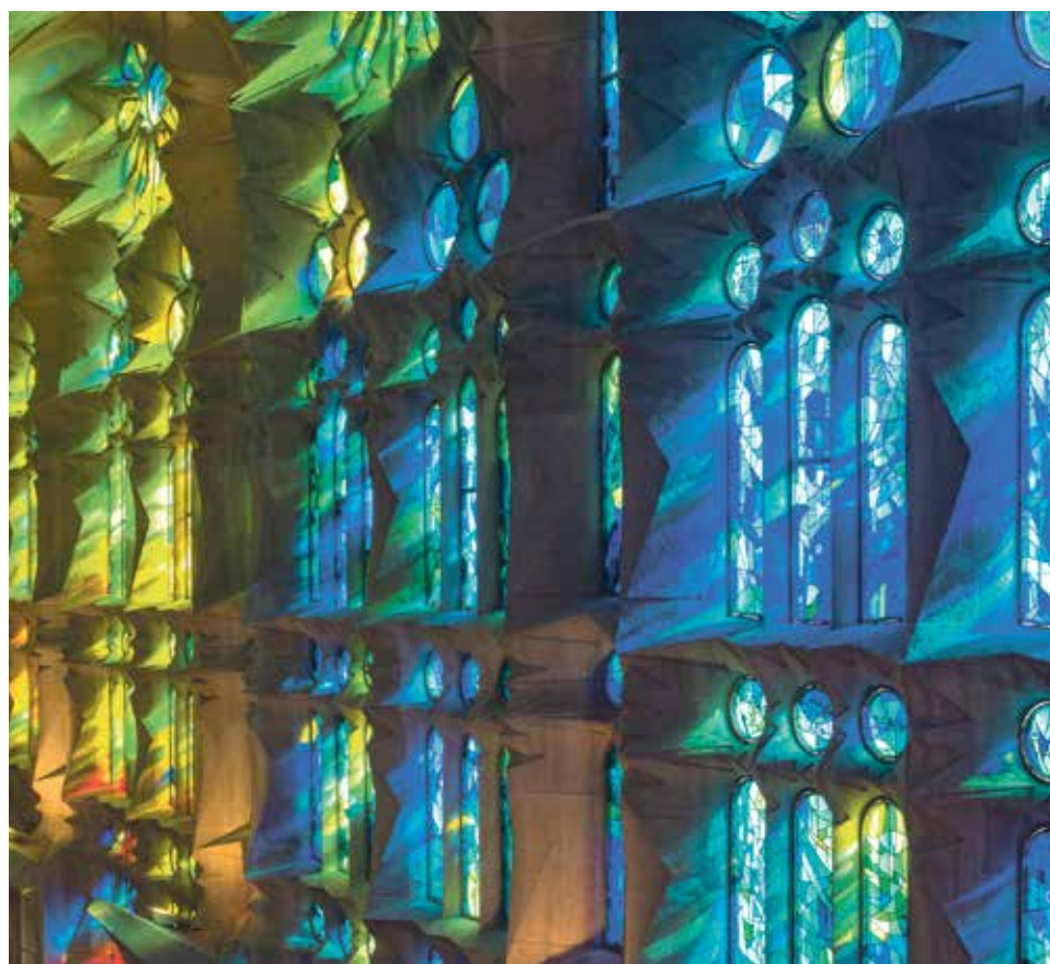
La Sagrada Familia de Barcelona atrae cada año a más de cuatro millones de turistas.

La muestra incorpora varias piezas audiovisuales y se cierra con una maqueta del templo finalizado, que permite conocer cómo será la Sagrada Familia una vez hecho realidad el sueño de Gaudí. De esta forma, Alma Mater Museum suma un hito más desde que en junio de 2016 se presentara a la sociedad con esa nueva marca.