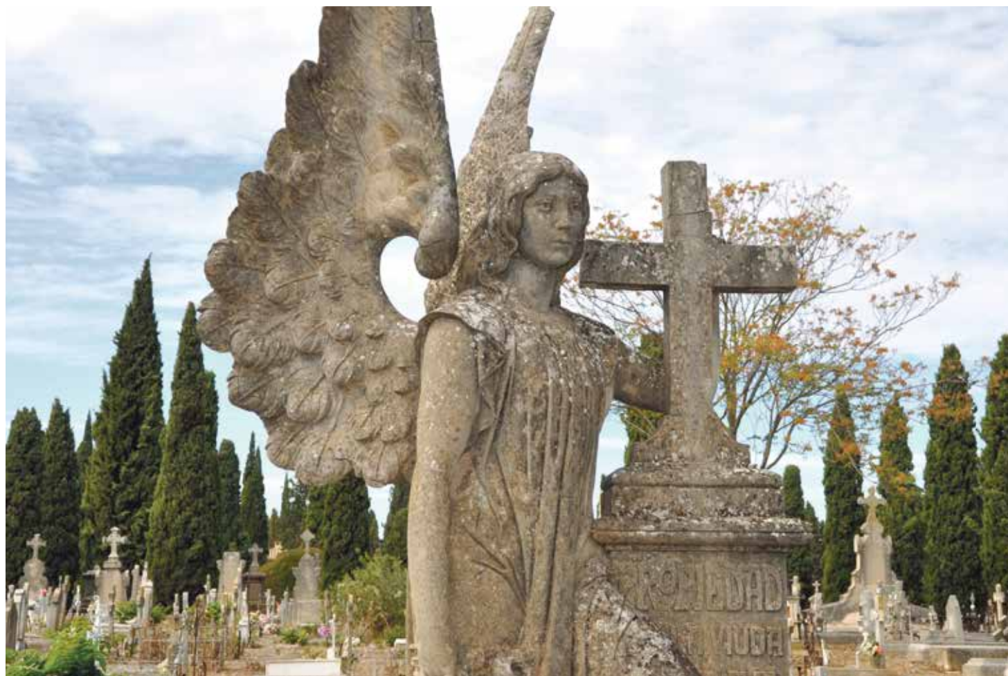
La vida eterna es la que comienza inmediatamente después de la muerte.

A las puertas del mes de noviembre, en vísperas de la solemnidad de Todos los Santos y de la conmemoración de Todos los Fieles Difuntos, ¿tiene clara cuál es la fe de la Iglesia sobre la muerte y la vida? Durante los próximos domingos queremos compartir con ustedes, de una manera clara y sintética, qué dice el Catecismo de la Iglesia Católica -su Compendio- sobre estas realidades últimas que nos acompañan, nos preocupan y forman parte de nuestra identidad, tantas veces puesta en jaque por la multiplicación de doctrinas místicas y esotéricas que no reflejan la doctrina del Evangelio ni la verdad del ser humano.