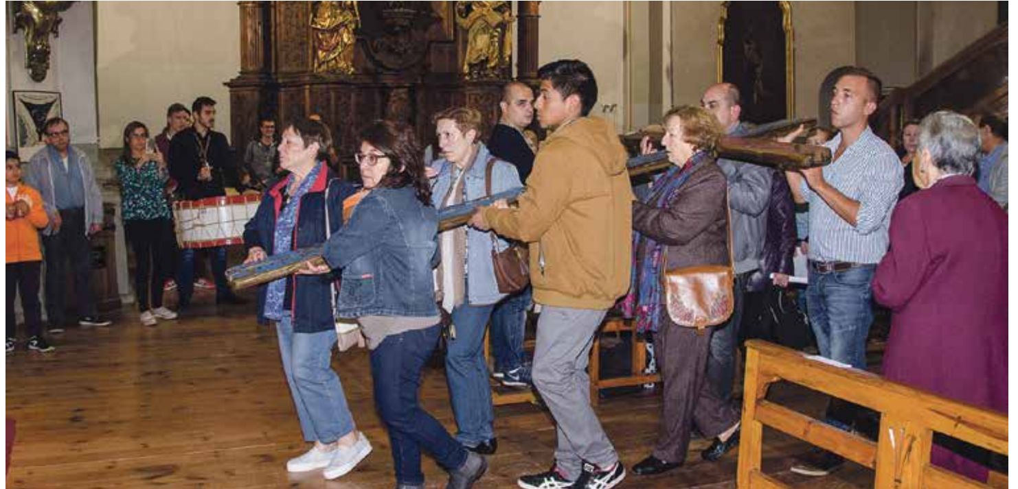
La Cruz evoca la realidad de los migrantes, verdaderos protagonistas de esta iniciativa pontificia.

Después de recorrer varios países y varias diócesis españolas, siguiendo el deseo del papa Francisco, el viernes 20 de octubre, la Cruz de Lampedusa llegó a la diócesis de Tarazona. Esta cruz está hecha con restos de las embarcaciones de los emigrantes que han llegado o han intentado llegar a Lampedusa.