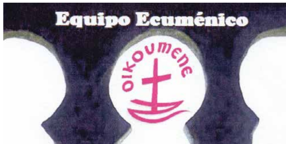
Equipo Ecuménico de Sabiñánigo.