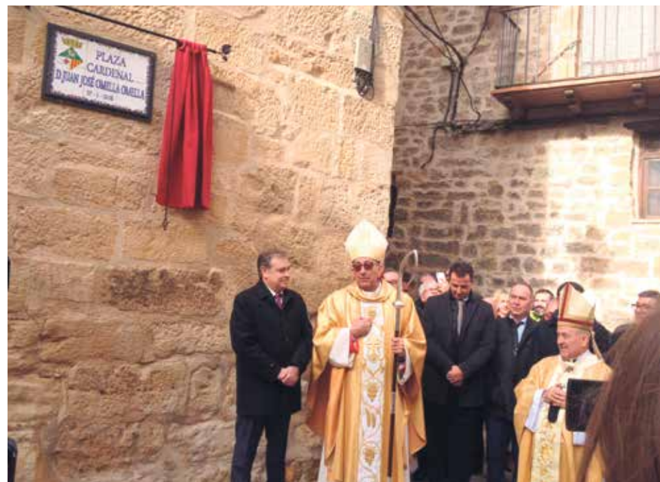
El pueblo de Cretas reconoció el servicio del cardenal Omella.

Además de la celebración litúrgica, el Cardenal recibió el homenaje de sus convecinos, quienes le distinguieron dando su nombre, 'Cardenal Omella', a la plaza en la que se abre la puerta del templo parroquial (s. XVI), magnífico ejemplo de la arquitectura gótico-renacentista de la zona.