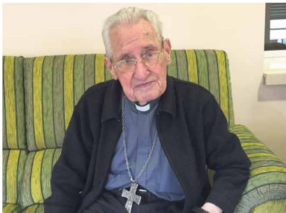
Don Damián reside en el Hogar Padre Saturnino López Novoa de Huesca.

Don Damián Iguacen Borau cumple 102 años el 12 de febrero. Obispo emérito de Tenerife, es el prelado de más edad de España y uno de los más longevos de toda la Iglesia católica. Reside en Huesca, donde se formó como sacerdote, conserva su lucidez y sigue recibiendo numerosas visitas a diario mientras hace honor a su lema: “Crear en Dios, esperar en Dios y amar a Dios”