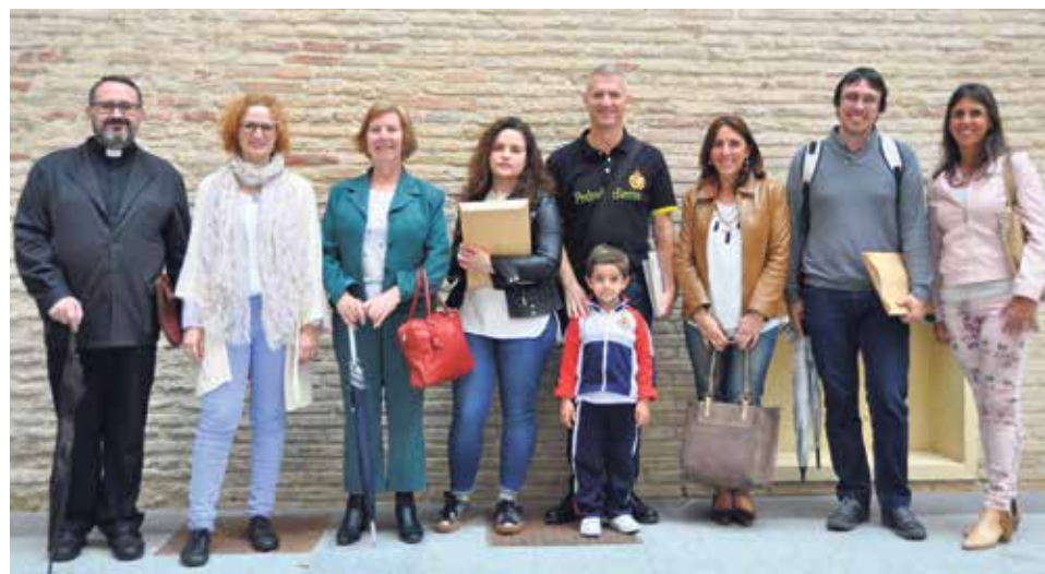
Los premiados de la primera edición, junto con sus familias.

Sí hay alguien a quien debemos parecer: a Jesús. Dios no quiere que