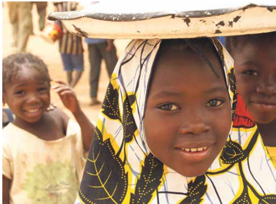
Analfabetismo y hambre van de la mano.

Con el lema 'Plántale cara al hambre', el trienio de lucha contra el hambre