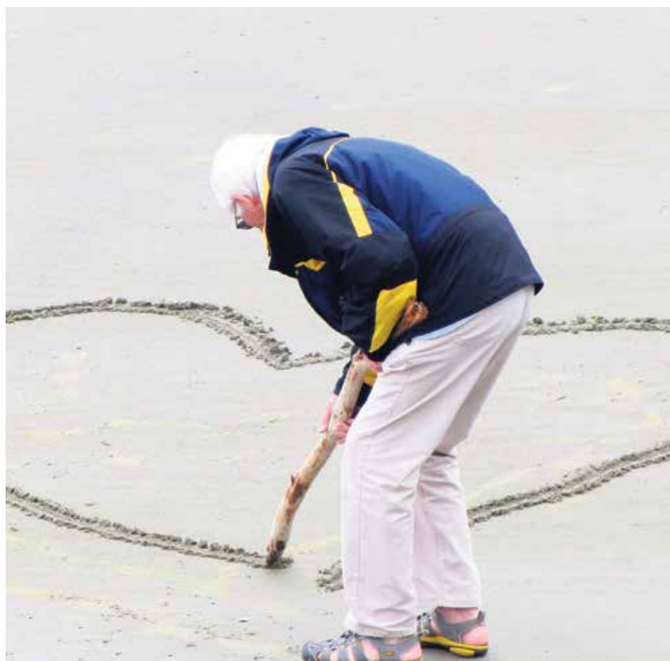
El apoyo de las familias ayuda a los enfermos a seguir hacia delante.