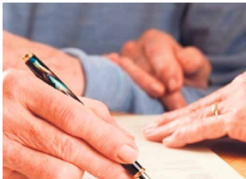
Es algo que todos deberíamos plantearnos, sabiendo que Dios es el mejor pagador.

Pero sí podemos hacer algo por ayudarla, en cualquiera de sus estructuras: diócesis, parroquias, fundaciones y asociaciones dependientes de ella. Algo tan simple como tenerla en cuenta a la hora de