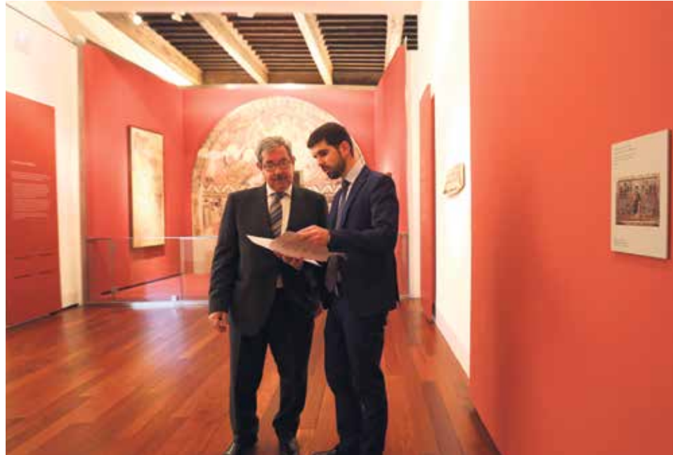
Barbastro está preparado para acoger los bienes.

La demanda quiere poner fin al litigio que se inició en 1995 con la modificación de los límites de las diócesis de Lérida y de Barbastro –a partir de entonces de Barbastro-Monzón–, lo que supuso un cambio en la situación patrimonial de bienes artísticos que habían sido trasladados desde diferentes parroquias hasta el Museo Diocesano de Lérida para su estudio y difusión. De acuerdo con el decreto "Ilerdensis-Barbastransis de finium mutatione", de 15 de junio de 1995, el patrimonio de las parroquias aragonesas transferidas de la diócesis de Lérida a la de Barbastro-Monzón