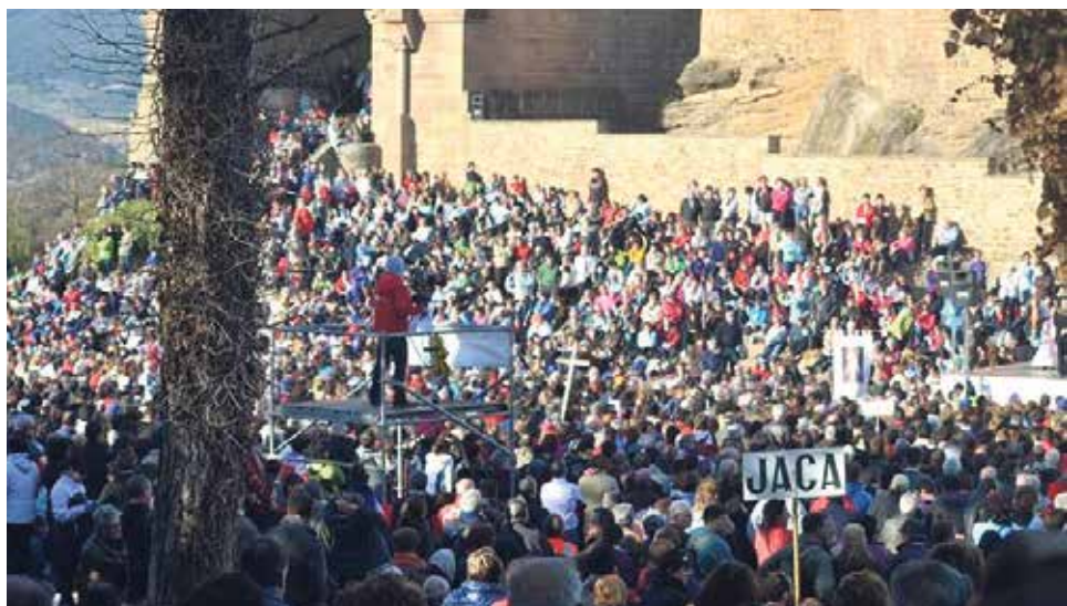
Peregrinos jacetanos en Javier.