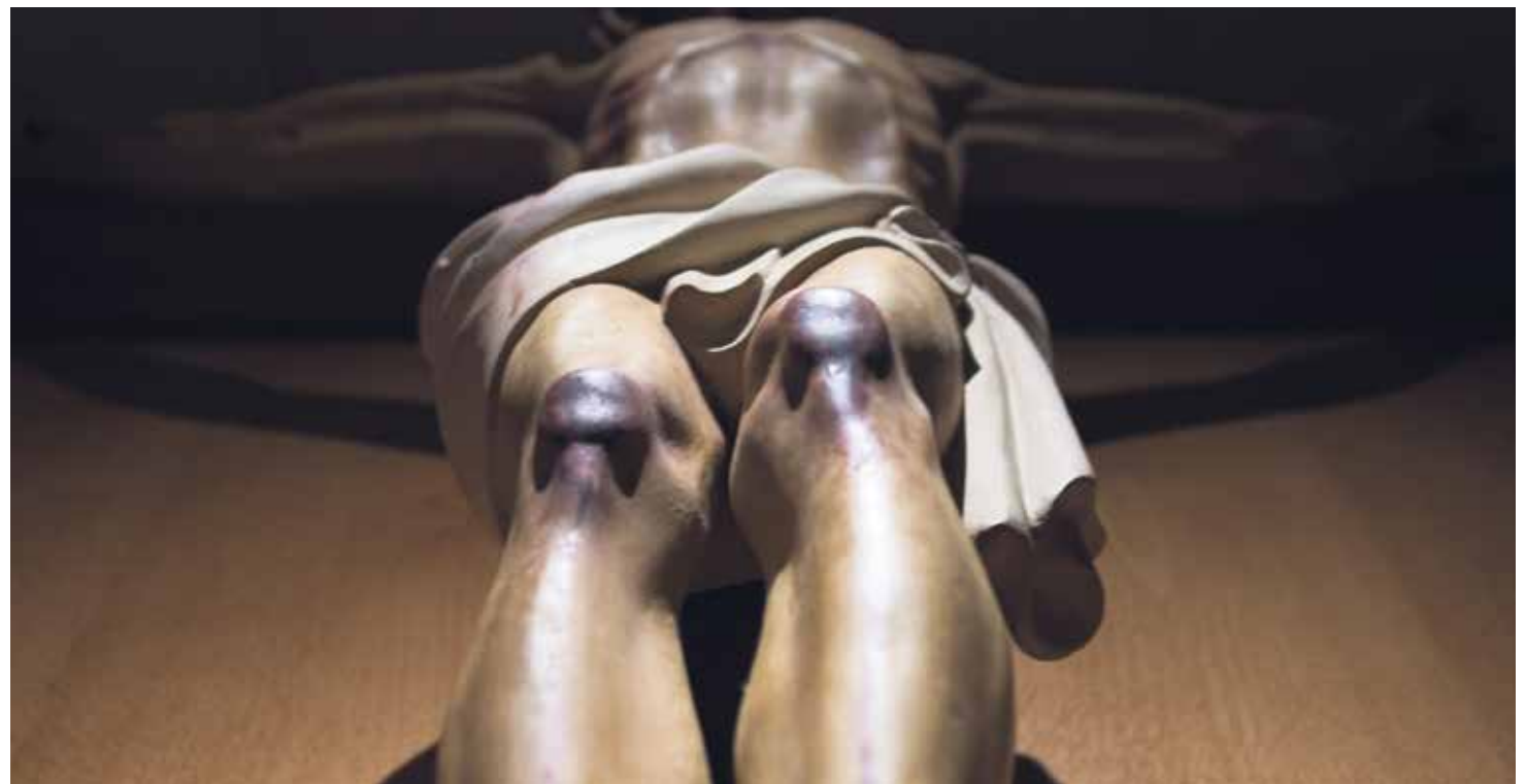
La Cuaresma supone el tiempo necesario, el tiempo completo, el tiempo oportuno que la Iglesia nos ofrece para nuestra salvación.

En el Nuevo Testamento, Jesús fue presentado en el templo a los 40 días de su nacimiento (Lc 2,22), como mandaba la Ley (Lev 12). Durante 40 días permaneció en el desierto antes de iniciar su vida pública (Mt