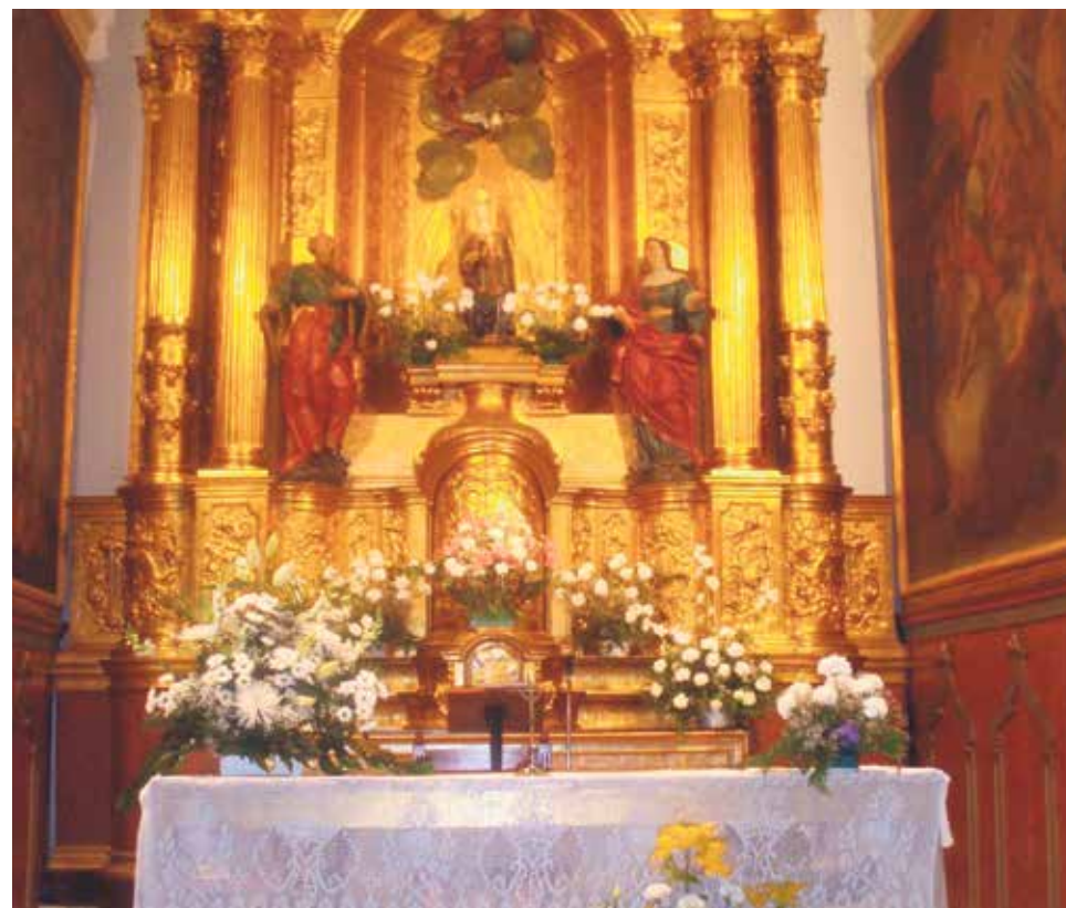
Altar Mayor de Monlora.