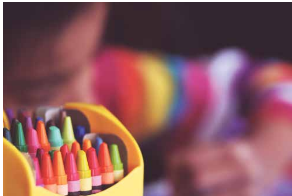
"Los profesores de Religión de la enseñanza pública son los más implicados en su formación."

Según Bernardino Lumbreras, delegado episcopal de Enseñanza de la diócesis de Zaragoza, los valores positivos de esta jornada son que los profesores se formen, así como proveer de un momento