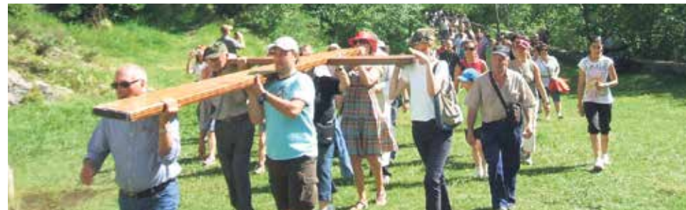
Cruz de la JMJ 2011 en Santa Elena.

El pasado martes, día 27, comenzamos el estudio de una nueva materia que lleva por título: "Los jóvenes y la Iglesia". Como siempre, os decimos que, si hay alguien interesado en asistir, puede hacerlo, aunque no haya venido hasta ahora.