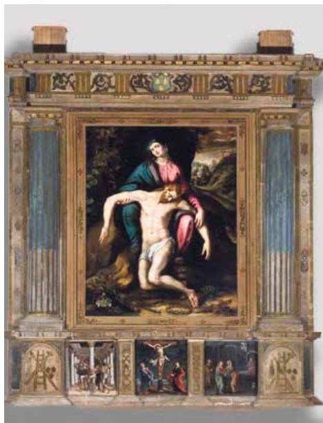
Retablo de la Piedad.

Finales del siglo XVI. Relieve y pintura sobre tabla. Procedencia desconocida