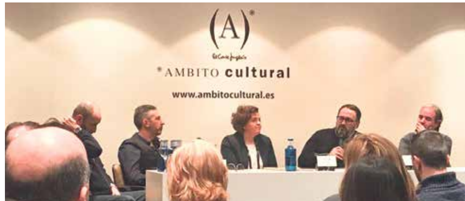
Las cofradías se esfuerzan por comunicar los 365 días del año.

En particular, Pardos contó la experiencia de las retransmisiones en directo de los momentos más sugestivos de las procesiones, llegando a "15, 20, 30.000 personas a través