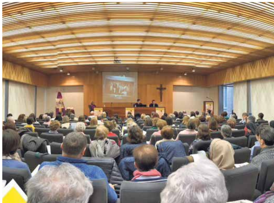
Evangelizar hoy exige adaptar los lenguajes y mantener una alegre experiencia de fe.

Por otro lado, el encuentro abordó la catequesis desde el arte, gracias