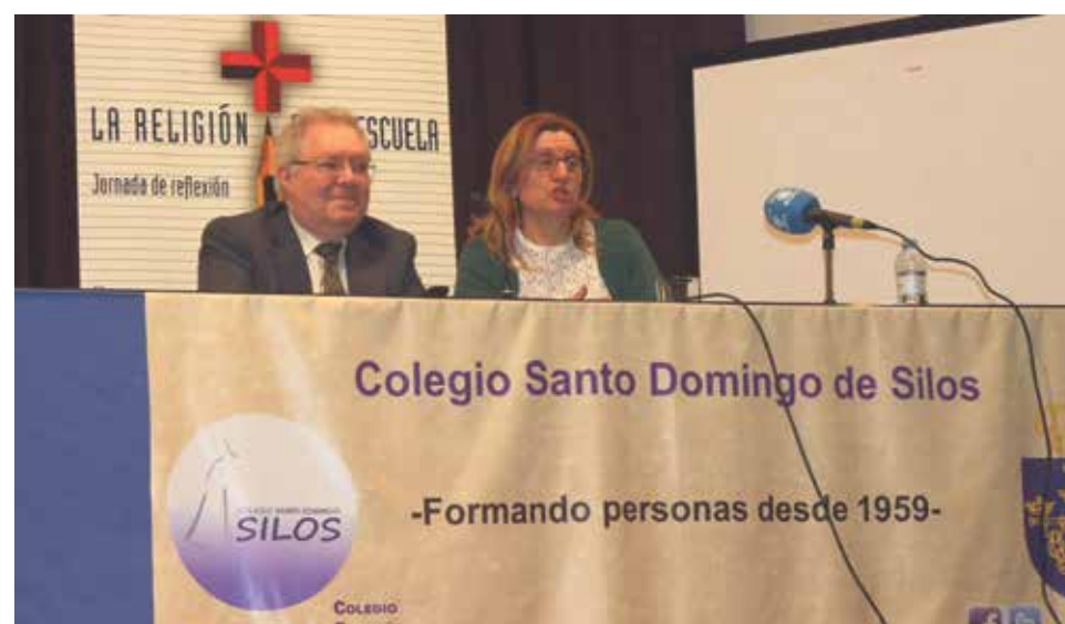
250 profesores reflexionaron el 17 de marzo en Zaragoza sobre la enseñanza religiosa.

Por ello, tal vez deberíamos tener presente la actuación de Jesús con Zaqueo. Cuando, a la entrada de Jericó, camino de Jerusalén, cerca de aquel árbol en el que estaba encaramado Zaqueo, lo llama por su nombre. Y lo saca del anonimato. Aquel hombre, como nos recuerda Francisco, "pequeño de estatura, rechazado por todos y distante de Jesús, que estaba como perdido en el anonimato", pero con el que Jesús hace un claro gesto de salvación. Todo un ejemplo.