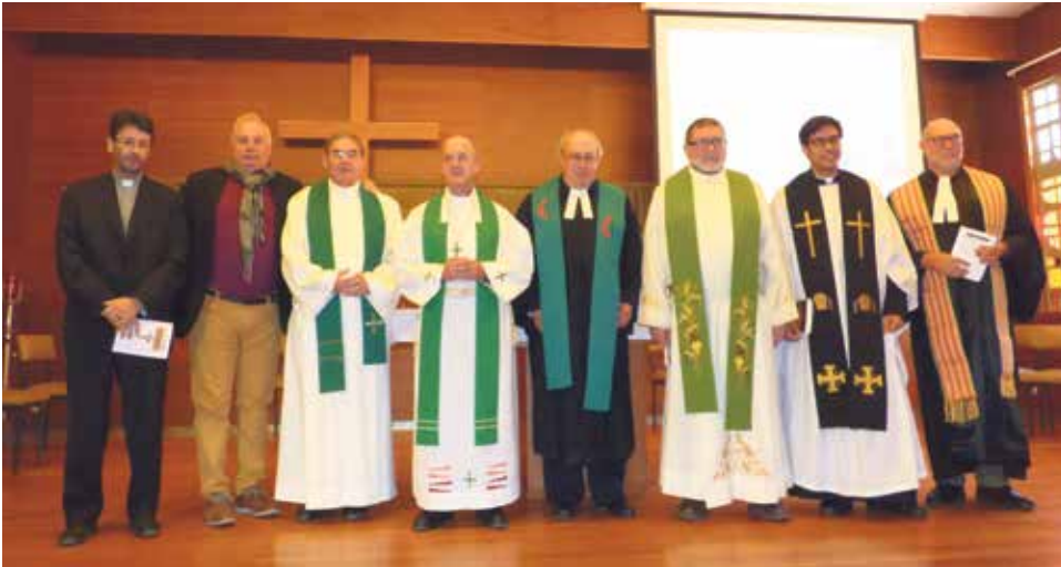
Celebración en Sabiñánigo de los 500 años de la Reforma.

El martes 31 de octubre de 2017 se cumplieron 500 años de la publicación de las famosas '95 tesis' contra la Iglesia católica de Roma con las que Martín Lutero inició la reforma protestante y creó una nueva forma de ver el mundo. La publicación de Cuestionamiento al poder y eficacia de las indulgencias en 1517 dio comienzo a una nueva era cuyos efectos en la religión, la cultura, la sociología y la economía siguen presentes en nuestros días.