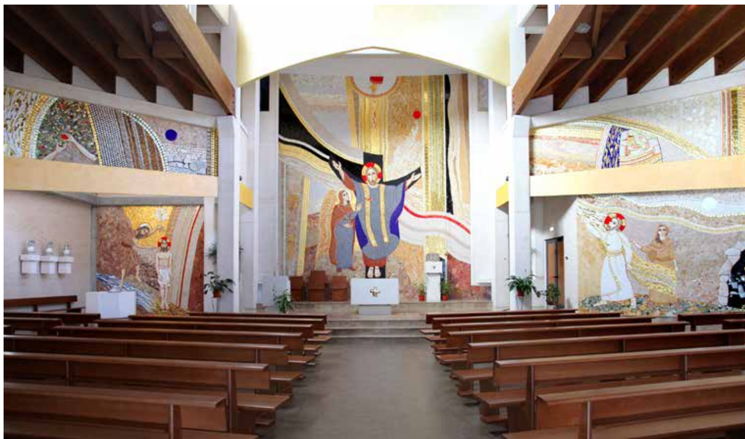
El gran mosaico realizado por Rupnik en la parroquia del Rosario de Zaragoza se inauguró en febrero de 2012.

La razón que ha llevado a Francisco a instituir esta fiesta es "incrementar el sentido materno de la Iglesia en los pastores, en los religiosos y en los fieles, así como la genuina piedad mariana".