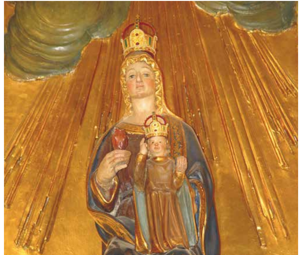
Nuestra Señora de Monlora.

Santa María: “Ella vivió como nadie las bienaventuras de Jesús. Ella es la que se estremecía de gozo en la presencia de Dios, la que conservaba todo en su corazón y se dejó atravesar por la espada. Es la santa entre los santos, la más bendita, la que nos enseña el camino de la santidad y nos acompaña. Ella no acepta que nos quedemos caídos y a veces nos lleva en sus brazos sin juzgarnos. Conversar con ella nos consuela, nos libera y nos santifica. La Madre no necesita de muchas palabras, no le hace falta que nos esforcemos demasiado para explicarle lo que nos pasa. Basta musitar una y otra vez: «Dios te salve, María...» (Papa Francisco, Exh. Apost. Gaudete et exsultate , 176).