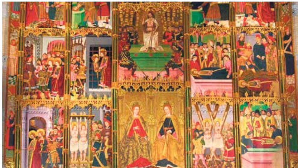
Retablo gótico de la iglesia de Santas Justa y Rufina (Maluenda) dedicado a su martirio.