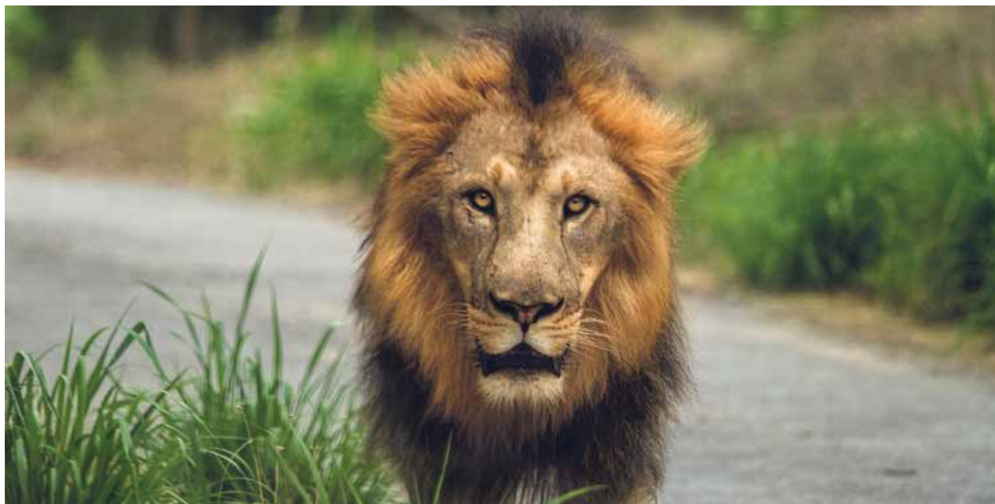
Nuestro camino hacia la santidad es también una lucha constante.

En el quinto y último capítulo de 'Gaudete et exsultate', el papa Francisco advierte que la vida cristiana es un combate permanente. Una lucha "muy bella" porque permite celebrar la victoria del Señor en nuestra vida, pero que requiere "fuerza y valentía para resistir las tentaciones del diablo y anunciar el Evangelio". Veamos las últimas reflexiones del Santo Padre sobre cómo vivir una santidad auténtica en nuestro mundo.