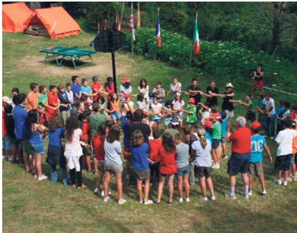
En el campamento caben todos los chavales porque se encuentran en la mutua entrega.

En el valle de Aragüés del Puerto (Huesca) existe un campamento que, desde hace más de 46 años, alberga a niños y jóvenes que quieren pasar la aventura más divertida durante 15 días del verano, haciendo amigos y creciendo en valores humanos universales. El campamento es un estímulo para, en plena naturaleza, crecer en el conocimiento de uno mismo y de lo necesario para ser feliz.