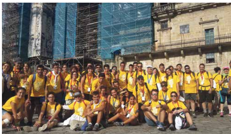
Jóvenes de las diócesis aragonesas, en la última peregrinación a Santiago.

Realizar este viaje es una manera excelente de contactar con uno mismo y de tener una experiencia fuerte e