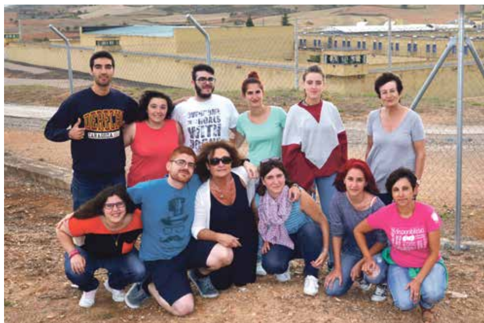
Voluntarios y formadores del campo de trabajo, frente a la cárcel de Daroca, el verano pasado.

Por las tardes, varios talleres en el área de la escuela y un taller en el módulo de enfermería que permitirán el trato cercano entre voluntarios e