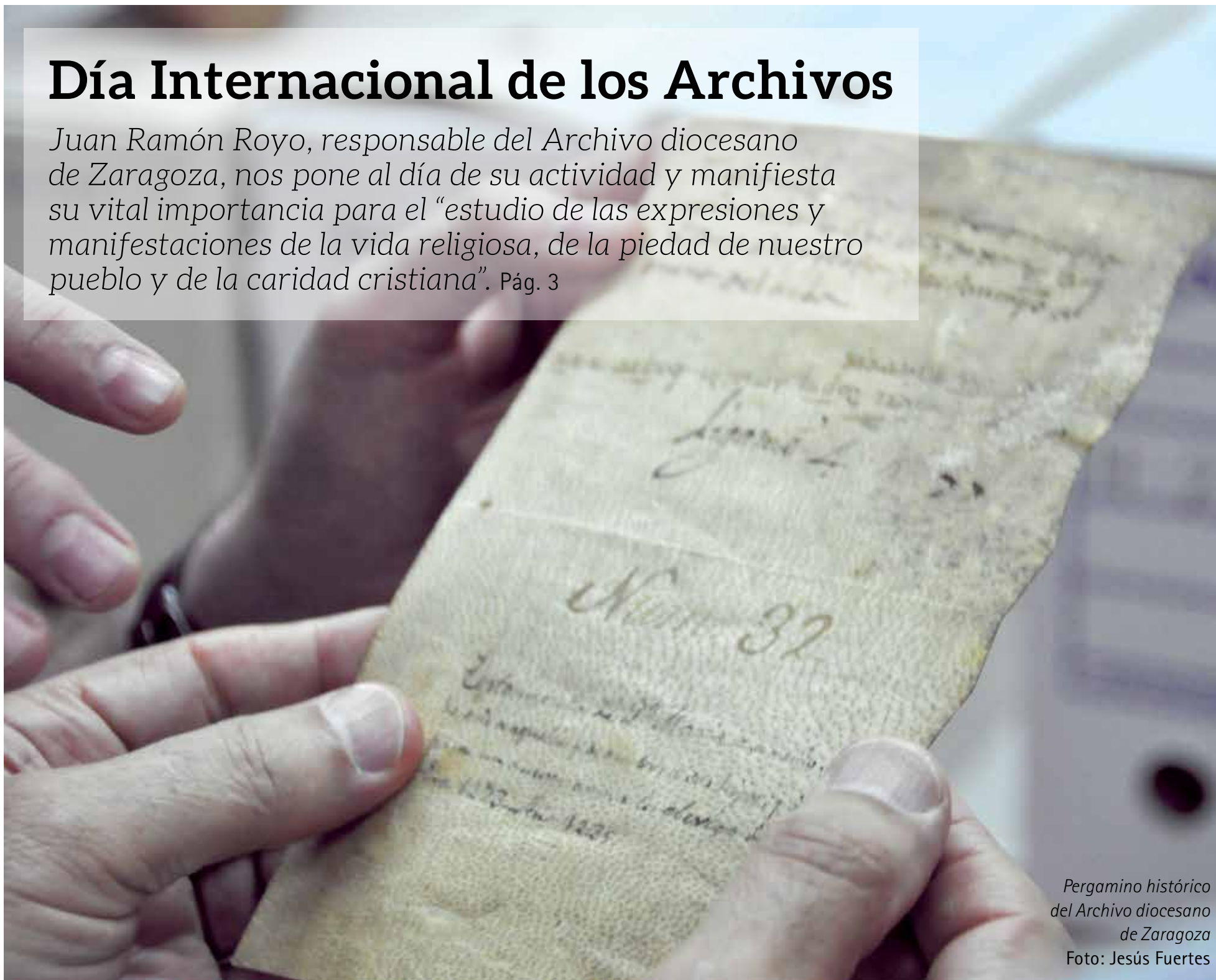
Pergamino histórico del Archivo diocesano de Zaragoza

Juan Ramón Royo, responsable del Archivo diocesano de Zaragoza, nos pone al día de su actividad y manifiesta su vital importancia para el “estudio de las expresiones y manifestaciones de la vida religiosa, de la piedad de nuestro pueblo y de la caridad cristiana”. Pág. 3