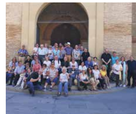
Foto de grupo del año pasado.

Peralta de la Sal, del 2 al 4 de julio. Una nueva edición de esta 'Escuela de Verano', organizada por la Comisión Regional de Catequesis de Aragón y que, en esta ocasión, quiere ayudar al catequista a reflexionar sobre su cometido. El objetivo es redescubrir que 'ser catequista' es una vocación: el catequista está llamado a estar con Dios y a anunciar el Evangelio.