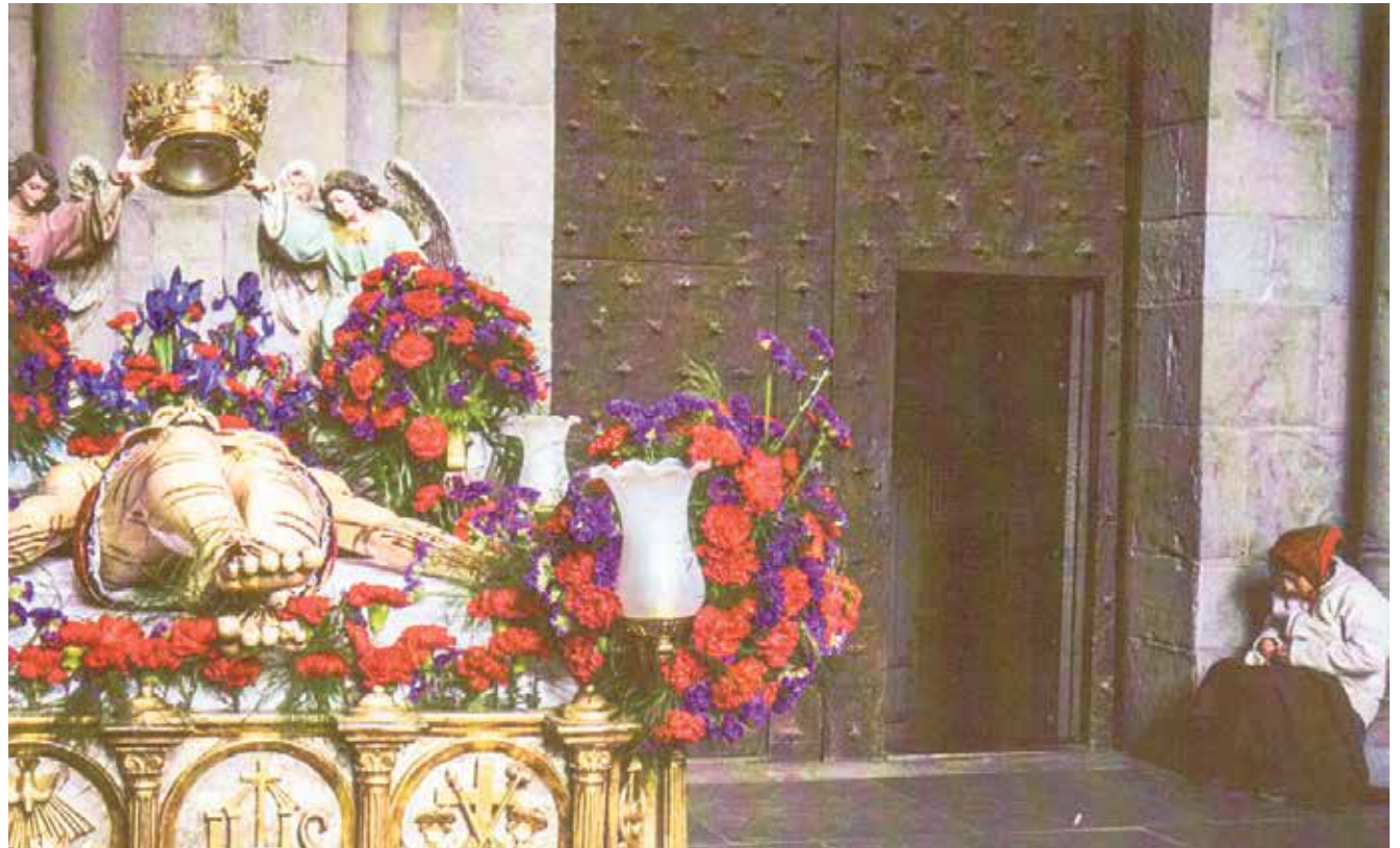
Cristo muerto, los pobres y las puertas de la Iglesia abiertas.