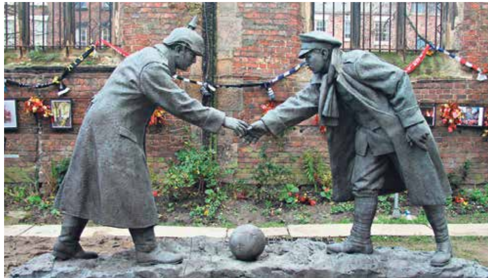
Escultura que representa la Tregua de Navidad, en la que un soldado alemán y otro británico estrechan sus manos para jugar al fútbol. Exterior de la iglesia de San Lucas, en Liverpool.

Nacido el 24 de octubre de 1873 en Theuley-les-Lavoncourt, al noreste de Francia, Jules Rimet vio la luz en una familia de profunda fe católica, una fe que se mantuvo cuando por razones económicas el clan tuvo que emigrar a París años después. Allí, en la capital francesa, el joven Jules entró en el Círculo de Obreros Católicos, donde se consolidó su creencia en la unión de todos los estratos sociales alrededor de un interés común. Gran aficionado al fútbol, empezó a considerar el deporte como un vehículo imprescindible para vencer las