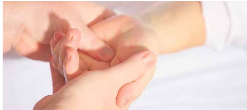
La medicina paliativa que reviste también una gran importancia en ámbito cultural.