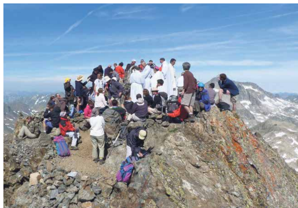
Misa en la Grande Fache, en 2013.