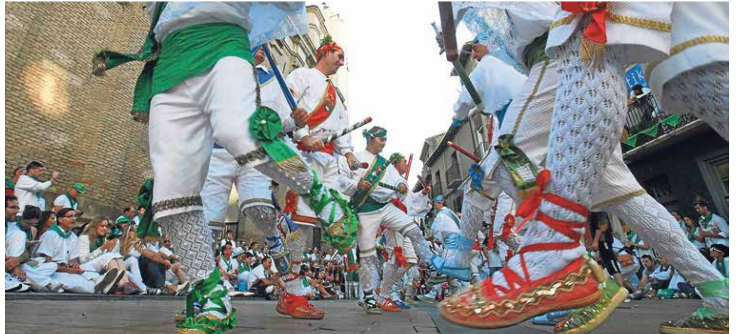
El dance de San Lorenzo es una expresión genuina de religiosidad popular.

Asimismo, fue arcediano o primer diácono del papa san Sixto II , quien le encomendó la administración de los bienes, los cementerios, limosnas, rentas y custodia de los archivos. Su entereza durante una muerte muy cruenta se representa en una frase pronunciada por san Lorenzo durante estos tormentos: "Ya estoy asado por este lado; da vuelta y come". Murió