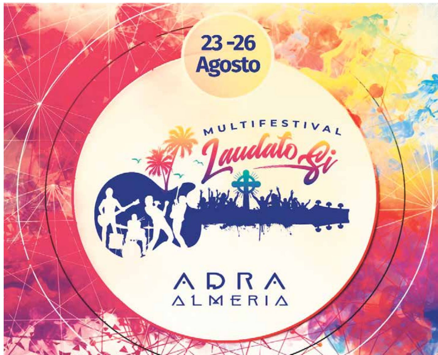
El Multifestival Laudato Si cierra el ciclo de festivales de música católica en verano.

Otro festival en Francia, muy relacionado con nuestro país, es