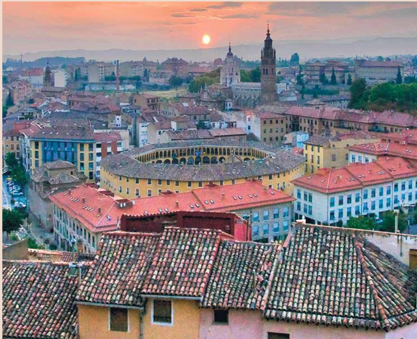
Panorámica de la ciudad de Tarazona con su catedral al fondo

Por fin, llegamos a Teruel en donde adquiere el arte mudéjar