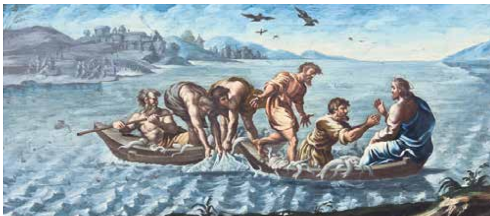
Bocetos de Fray Manuel Bayeu.

1791-1792. Óleo sobre lienzo. Catedral de San Pedro de Jaca