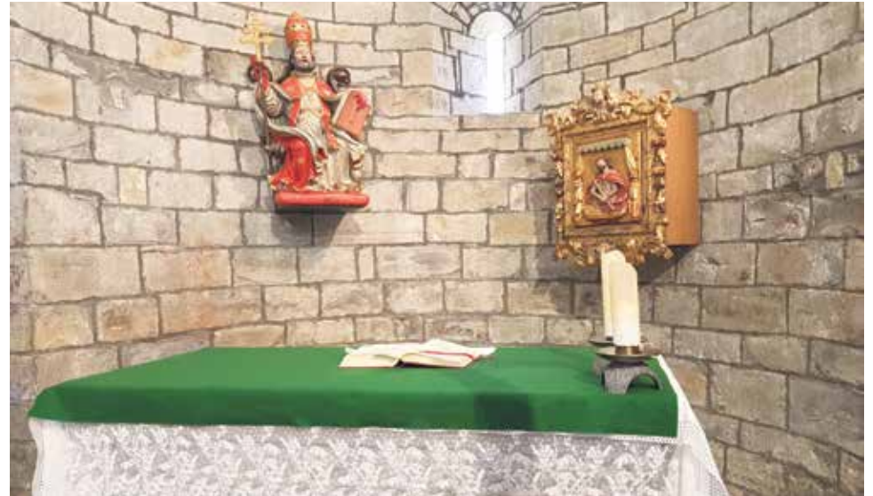
Altar y talla de San Pedro Apóstol. Caniás.