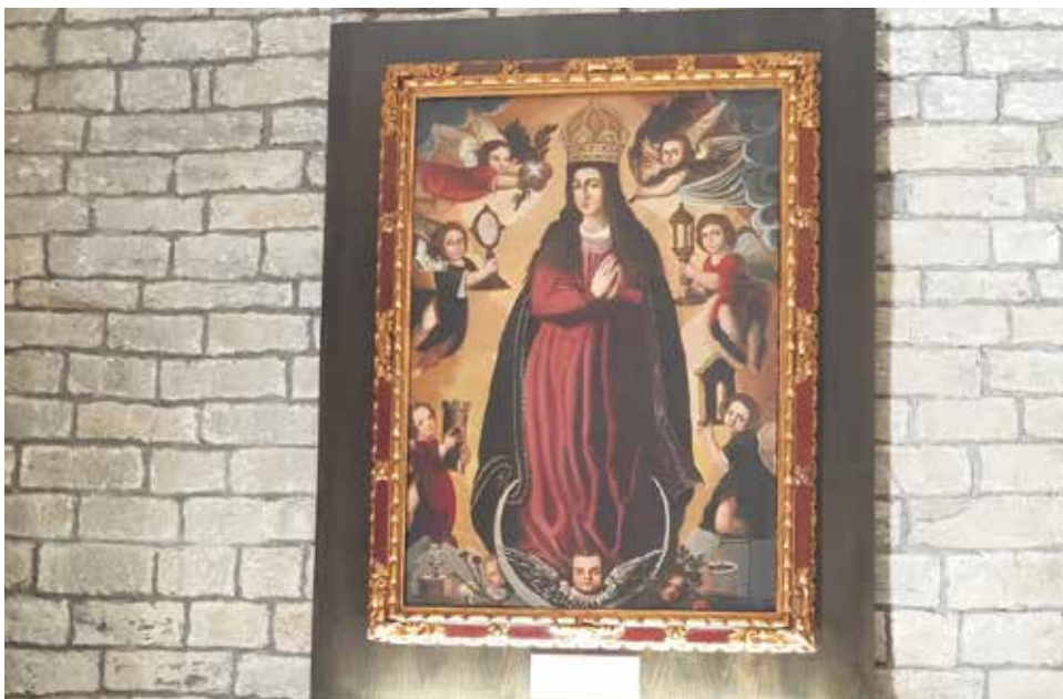
Santa María, Reina de los Ángeles. Caniás.