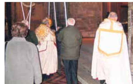
Minerva en la S. I. Catedral.