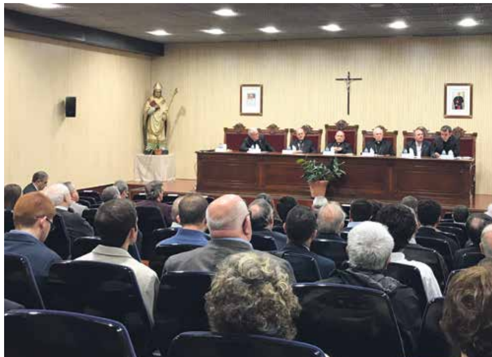
Los obispos aragoneses encabezaron el solemne acto académico.