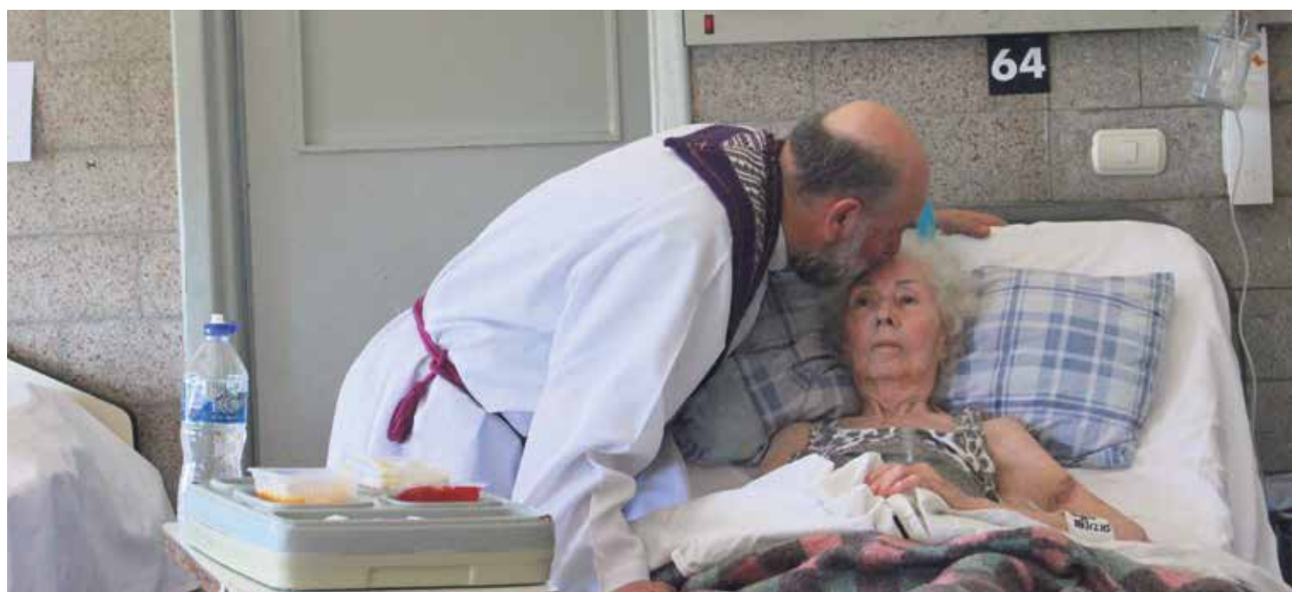
La Iglesia construye una sociedad mejor con su servicio cotidiano, en especial, a los más necesitados.

El folleto "NUESTRA IGLESIA", editado en cada diócesis con una versión