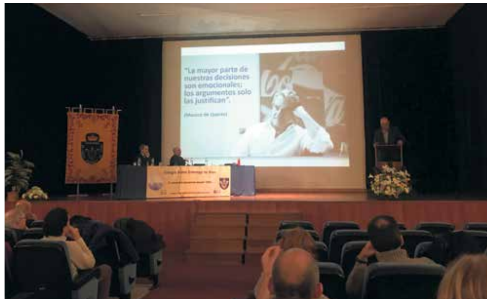
Merayo pronunció una conferencia sobre los desafíos de la posverdad en el ámbito educativo.

Tras el saludo del director del Silos y la oración inicial, Merayo destacó cómo la labor del educador en estos momentos no es tanto la transmisión de saberes -todos ellos al alcance de Google y cualquier smartphone en un clic-, sino el despertar la identidad de las personas que han sido puestas en sus manos para ser educadas. Los niños