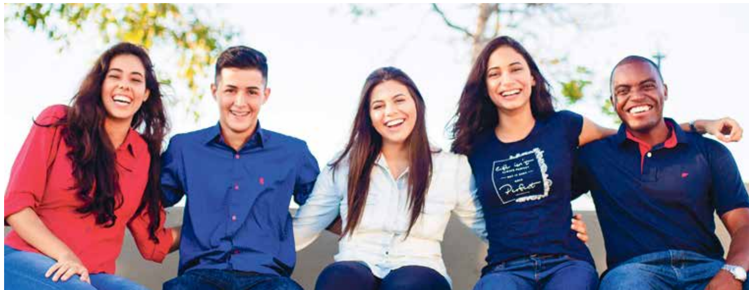
La Iglesia debe acompañar a los jóvenes desde su realidad, un acompañamiento que no juzga sino que se pone al servicio.

El camino de los discípulos de Emaús (Lc 24, 13-25) es el texto evangélico que ha servido de telón de fondo al Sínodo de los Obispos para proponer al papa Francisco nuevas intuiciones sobre una pastoral juvenil y vocacional para el siglo XXI. Este documento final, dividido en tres partes, busca llevar a cabo esta misión a la espera del documento magisterial que esperamos que el papa Francisco publique próximamente con nuevas y apasionantes orientaciones.