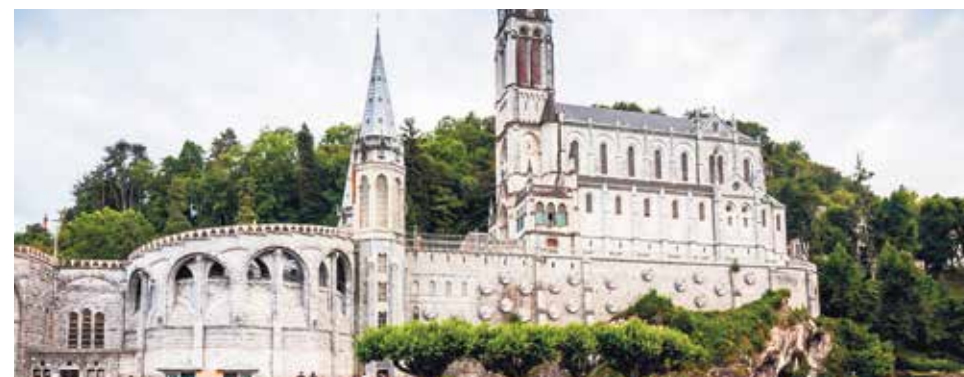
Santuario de Lourdes.

El 7 de junio de 2013 fue erigida la Hospitalidad de Nuestra Señora de Lourdes de la Diócesis de Jaca, una asociación integrada por personas que voluntariamente se ofrecen para servir y cuidar a todos cuantos -enfermos y sanos- desean peregrinar al santuario de Lourdes y vivir su espiritualidad cristiana en el marco de esta advocación mariana.