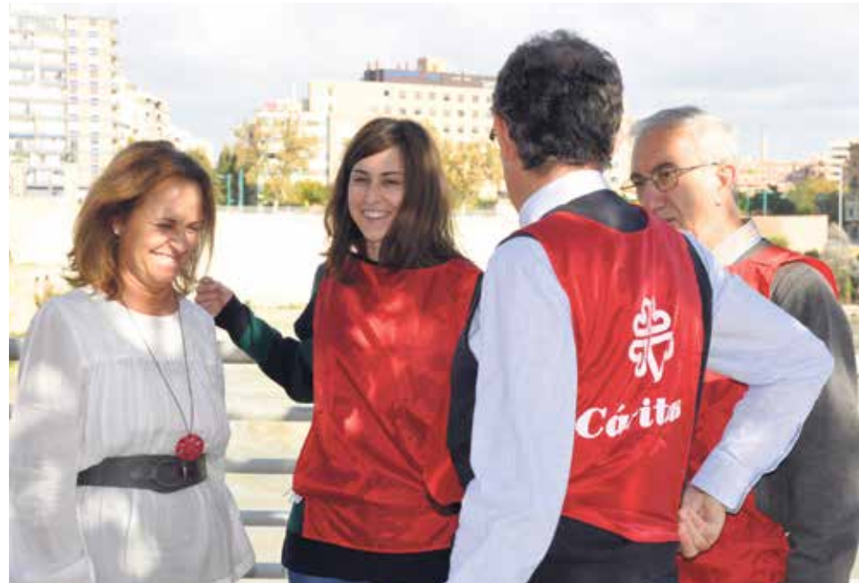
Cáritas es una de las muchas iniciativas de la Iglesia que lucha contra la desigualdad.

“ Debemos estar atentos y fortalecer nuestro tejido social