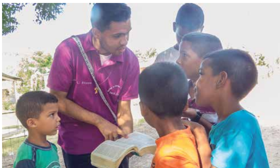
¿Qué hacer para que esta Iglesia joven crezca fuerte y dé frutos?

Estos catequistas tienen tanta importancia que la Iglesia universal les dedica una jornada y una colecta pontificias, que coincide con el día de la manifestación del Señor a todos los pueblos de la tierra, con la Epifanía, la fiesta de Reyes. La de este