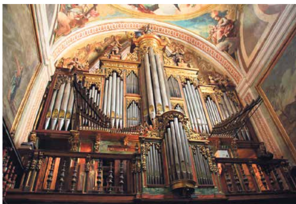
El órgano suena con regularidad en los actos religiosos.

La obra incluye un CD, bajo el título 'La escuela romántica española para órgano (1853-1900)', que por primera vez recoge una visión de este periodo