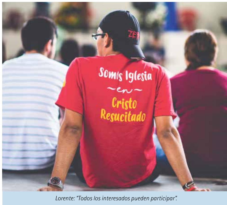
Lorente: "Todos los interesados pueden participar".

Para responder a estas preguntas, la delegación episcopal para la 'Aplicación y el Seguimiento del Plan Diocesano de Pastoral' ha organizado una jornada de reflexión que se