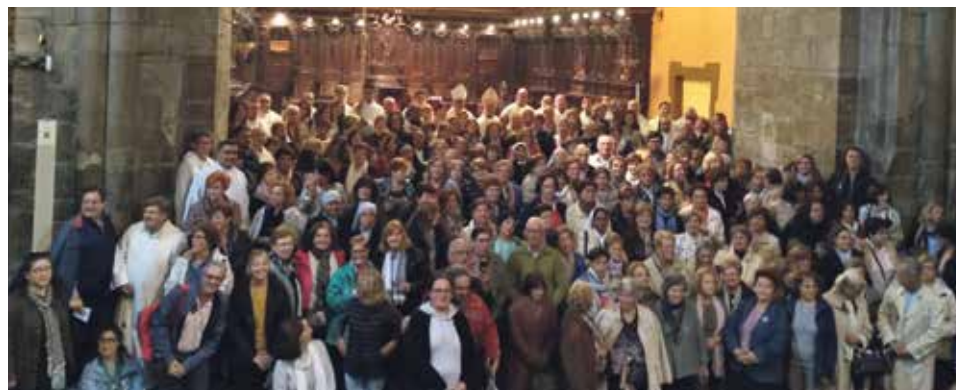
Encuentro Regional de Catequistas de Aragón en Jaca.