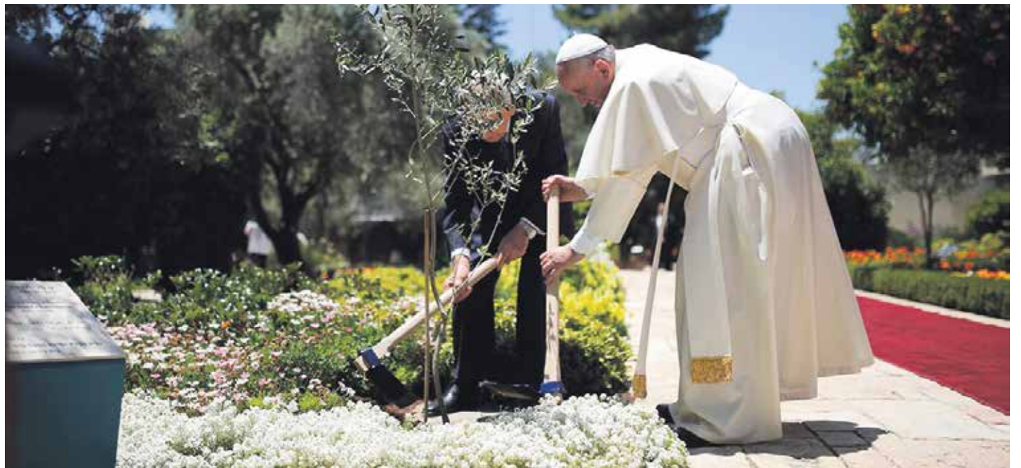
Hay tres espacios donde vivir la paz: con uno mismo, con el otro y con la creación.

“Paz a esta casa”. Con estas palabras comienza el mensaje del papa Francisco para la 52ª Jornada Mundial de la Paz, que se celebra el primer día del año. “Dar la paz –escribe el Papa– está en el centro de la misión de los discípulos de Cristo. Y este ofrecimiento está dirigido a todos los hombres y mujeres que esperan la paz en medio de las tragedias y la violencia de la historia humana”.