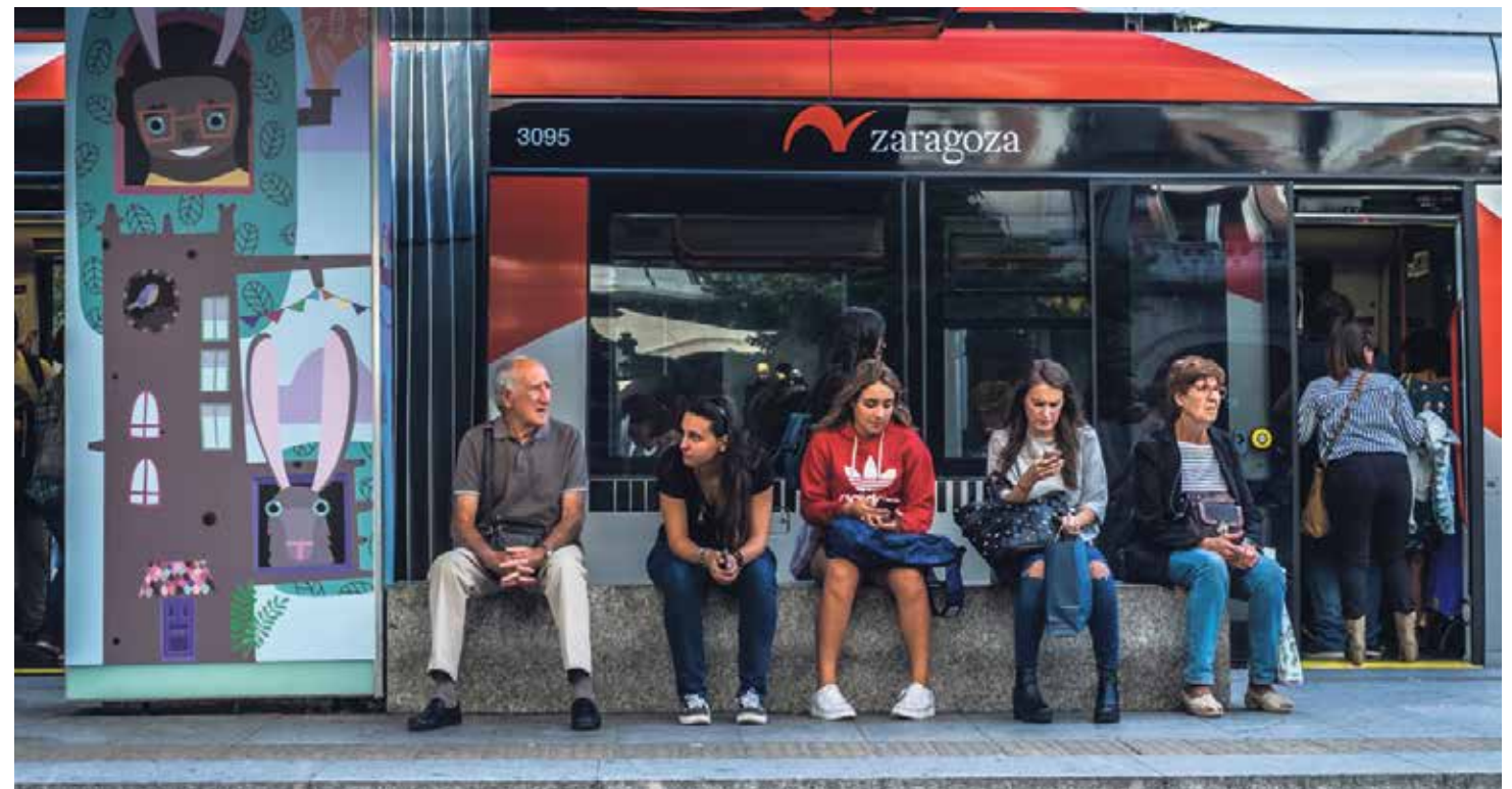
Las nuevas tecnologías pueden facilitar el diálogo con Dios en la vida cotidiana.

3. Diez minutos con Jesús. Esta reciente iniciativa la gestiona un grupo de sacerdotes amigos a los que les une el deseo de "transmitir a los jóvenes el arte de amarle y de