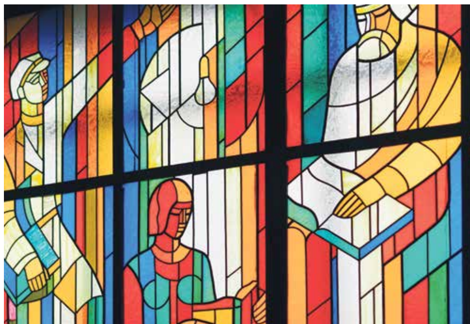
Las diócesis aragonesas promueven una formación permanente para clérigos y laicos.

Las diócesis aragonesas promueven esta formación permanente dirigida tanto a clérigos como a laicos. En Jaca , la Escuela Diocesana de Formación, con sedes en Sabiñánigo y Jaca, que durante este trimestre va a tratar cuestiones en torno al 'Evangelio según San Mateo' y la exhortación ' Gaudete et Exultate '. La Escuela Diocesana de Teología San Lorenzo, en Huesca , y el Instituto de Estudios Teológicos San Joaquín Royo, en Teruel , con sus programas propios. Además, desde el curso pasado, el CRETA ofrece una posibilidad de formación