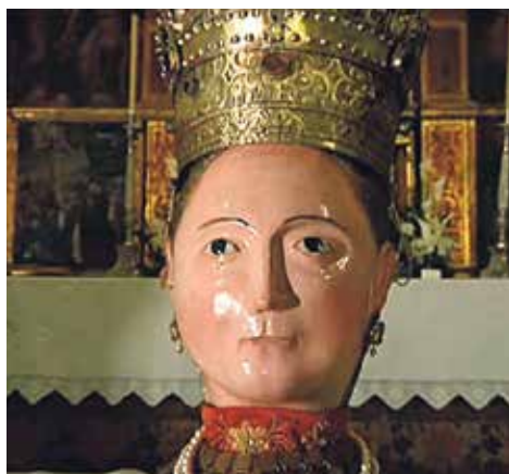
Busto de la Cabeza de Santa Orosia.

La exposición "Pasión por Zaragoza", que se está celebrando en la ciudad del Ebro, pretende conmemorar momentos muy importantes de su historia. Uno de ellos es la creación en 1318 del Arzobispado de Zaragoza. Por ese motivo se decidió reunir en la muestra los Bustos de los santos que ostentan el patronazgo de cada una de las diócesis de Aragón: San Lorenzo (Huesca), Santa Emerenciana (Teruel), Santa Engracia (Zaragoza), San Ramón (Barbastro), San Atilano (Tarazona) y Santa Úrsula (Calahorra), diócesis que también perteneció a este arzobispado. Para representar a la diócesis de Jaca se solicitó la presencia del Busto-Relicario de Santa Orosia, custodiado en Yebra de Basa.