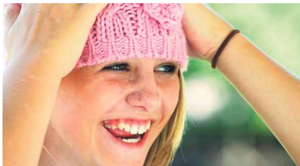
Para los cristianos la alegría es una virtud, no un estado de ánimo.

Es verdad que hay situaciones muy complicadas, pero tenemos que