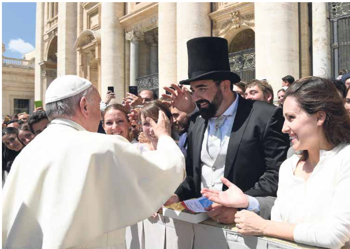
"Muchos cónyuges cristianos son un sermón silencioso para todos, un sermón 'de día laborable', de todos los días", afirmó el Papa.

El Papa recordó que, en el trabajo cotidiano al servicio del matrimonio cristiano, los integrantes del Tribunal apostólico tienen experiencia de los dos fundamentos principales del matrimonio y de la Iglesia misma: unidad y fidelidad. "Dos valores importantes", dijo el Santo Padre, que "no son necesarios solo entre los cónyuges sino en general en las relaciones interpersonales y aquellas sociales", recordando los