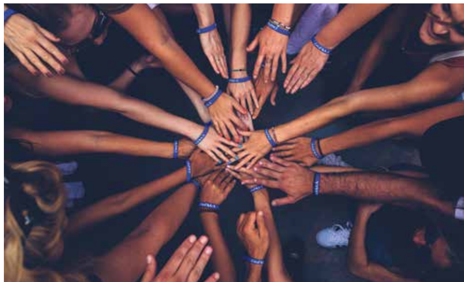
La exposición muestra la historia de personas que han llegado a España desde otros países.

Compartir el viaje con las personas migrantes supone asumir la propuesta del papa Francisco de "acoger, proteger, promover e integrar". Ese es el camino que enlaza los testimonios de los protagonistas de la exposición.