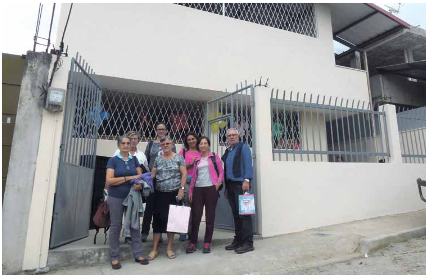
El equipo de Manos Unidas, durante su visita en octubre de 2018 a una obra social de la entidad en Ecuador.

En octubre del año pasado estuvo en Ecuador, en uno de los viajes formativos que se llevan a cabo anualmente en Manos Unidas. “Allí visitamos varias fundaciones de la sierra andina”, declara, “y hay una pobreza extrema, no puedo decir mucho más, nos queda mucho