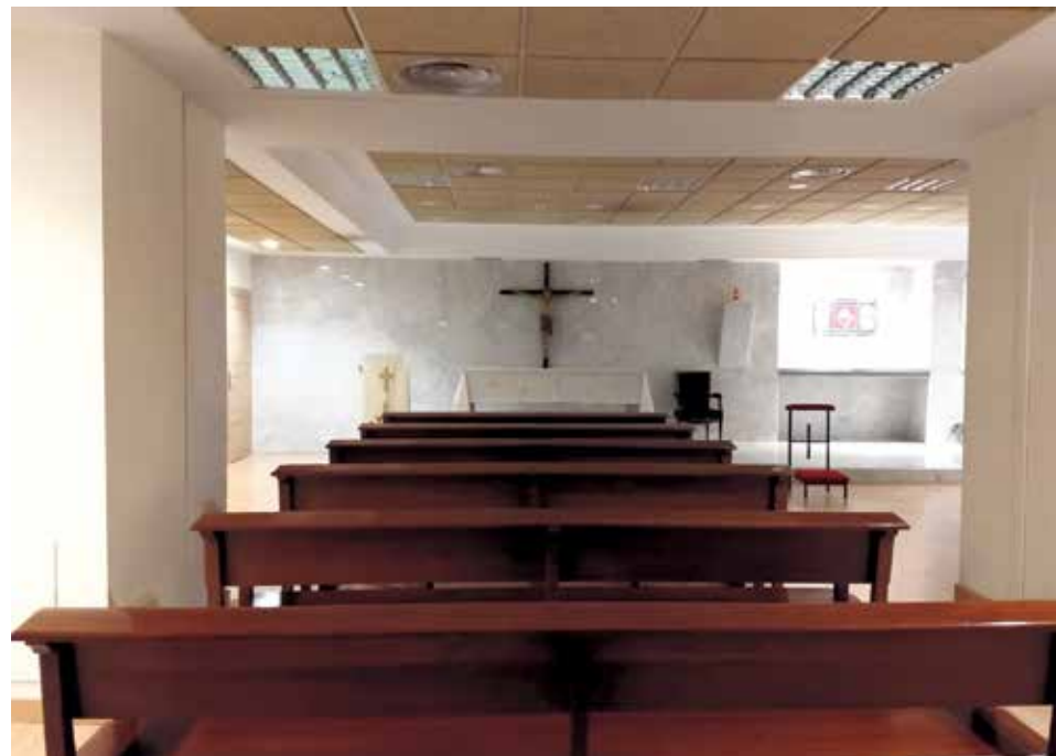
Los poderes públicos tienen que facilitar el ejercicio de los derechos fundamentales.

En primer lugar, en modo alguno queda lesionada la neutralidad de