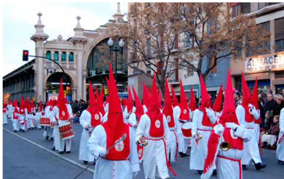
La cofradía de 'La columna' de Zaragoza lucirá esta Semana Santa un nuevo paso.

Los martes del mes de marzo, desde el pasado día doce, se está celebrando un ciclo cultural que, organizado por la Junta, tiene lugar en el 'Ámbito cultural' de El Corte Inglés de Independencia. La presentación del 'XIV Encuentro Regional de Cofradías Penitenciales de Aragón' que tendrá lugar en Zaragoza los días 9 y 10 de noviembre, y estará organizado por las Siete Palabras; la proyección del audiovisual 'Somos más que lo que tus ojos ven', sobre la acción social de las cofradías; el XXV aniversario de la Asociación para el Estudio de la Semana Santa o la mesa redonda 'La Semana Santa en los medios de comunicación' son algunos de los asuntos tratados. La última sesión de este ciclo, el martes 26, a partir de las 19.00 horas, tiene como centros de interés la presentación del proyecto de