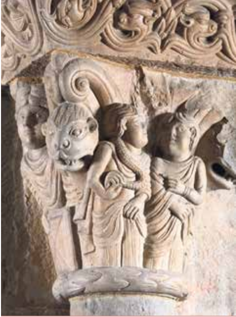
Capitel de la Sala Capitular.

Románico. Siglo XII. Piedra labrada. Procede del claustro de la Catedral.