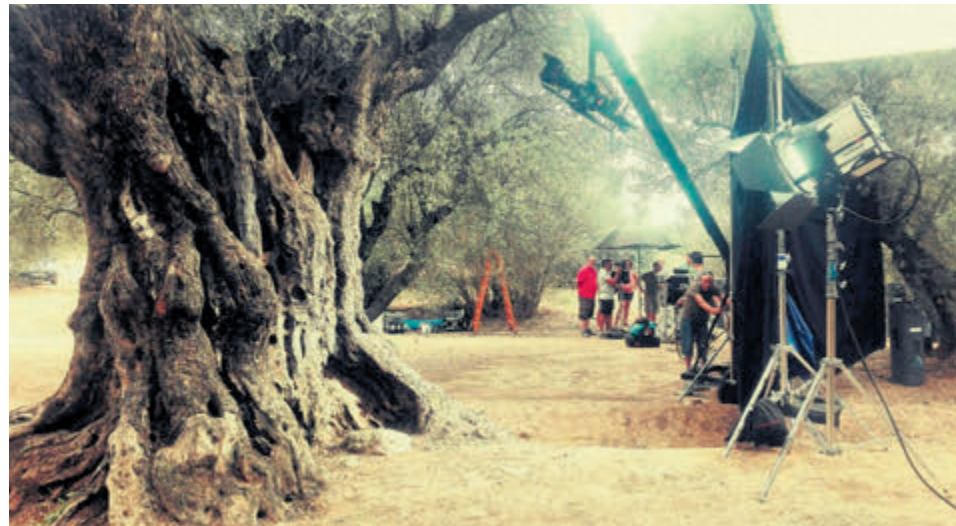
'Inmortal' une a las personas alrededor de la fe y la pasión de la Semana Santa.

El cortometraje 'Inmortal', un proyecto con el que el Arzobispado de Zaragoza pone en valor la Semana Santa en Aragón, podrá visualizarse de manera gratuita del 9 al 30 de abril en Alma Mater Museum (plaza de la Seo, 5). El audiovisual, producido por 'Brand in Black' y premiado en el IX Festival Internacional de Cannes, pone de manifiesto el sentir de los miles y miles de aragoneses que año tras año hacen posible la celebración de la Semana Santa.