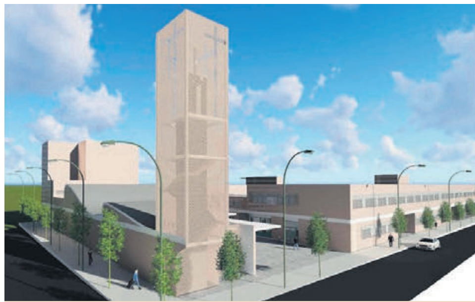
El complejo estará situado en la avenida Puente del Pilar, frente al colegio Hilario Gimeno.

Zaragoza. 1447. Unos religiosos franciscanos, enviados por san Bernardino de Sena, llegan al Arrabal. La fundación se llama Convento de Nuestra Señora de Jesús, de donde toma denominación el actual barrio de Jesús. Tras la Desamortización, después de cien años de ausencia de los franciscanos en Zaragoza, vuelven el 11 de agosto de 1940, fundando una residencia en el mismo barrio de Jesús, con entrada por el Camino del Vado. Constaba de un garaje, destinado a Iglesia, y una granja con