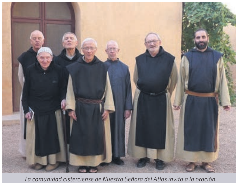
La comunidad cisterciense de Nuestra Señora del Atlas invita a la oración.

Por supuesto que no hay que establecer comparaciones entre la Cuaresma y el Ramadán. Son dos cosas distintas, puesto que la Cuaresma es tiempo de penitencia, mientras que el Ramadán es tiempo de fiesta. Eso sí, ambas son preparación a una gran fiesta. Los cristianos para la preparación a la fiesta por excelencia, la Pascua. Y los musulmanes celebran este mes la revelación, la noche de 'Laylat al Qadr'