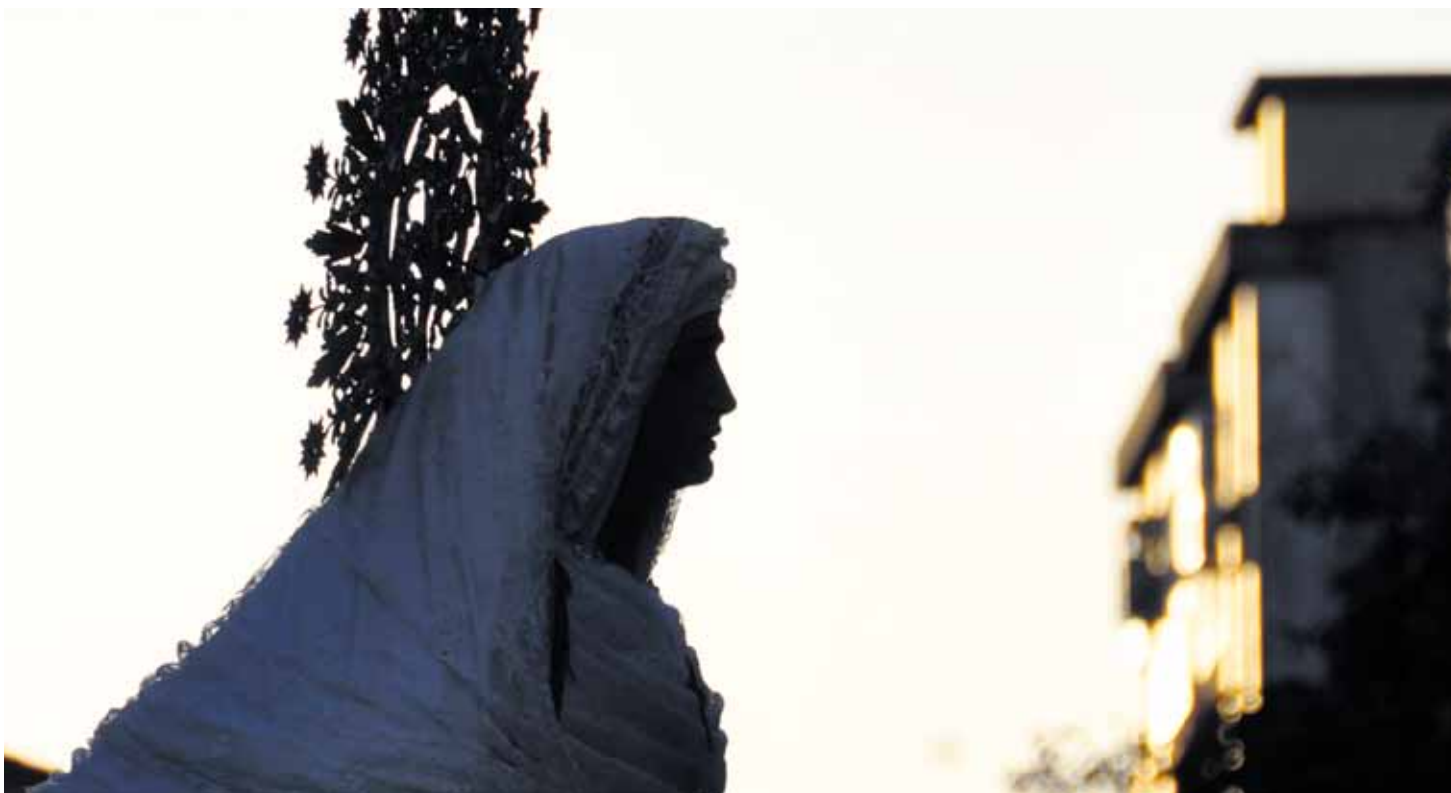
María mantuvo fielmente la unión con su hijo hasta la cruz y más allá de ella.

irreemplazable. Aquí se inscriben ciertas corrientes filosóficas y teológicas que arrancan de Kant y que encuentran eco en la afirmación de Heidegger, aunque en otro contexto: "nadie muere por nadie". Es la visión subjetivista y cerrada de la existencia, de la persona y de la libertad.