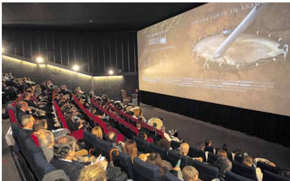
Más de 300 personas respondieron a la llamada de la diócesis de Zaragoza.

El Centro de Estudios de la Orden del Santo Sepulcro carece de fines lucrativos y tiene como objeto principal fomentar los estudios sobre las órdenes Canónica y de Caballería del Santo Sepulcro de Jerusalén en sus aspectos históricos, artísticos, espirituales y sociales, promoviendo la celebración de jornadas de estudio y congresos. Asimismo, procura becas y crea un archivo histórico de la Orden y una biblioteca especializada.