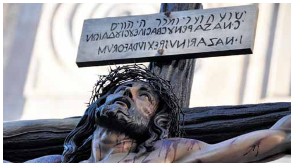
La oración de Cristo en la cruz se eleva en nombre de toda la humanidad.