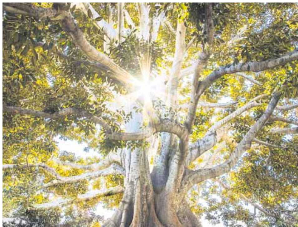
La alegría y fortaleza cristiana radica en la Resurrección.

La alegría cristiana "no es algo que se pueda comprar, o que se pueda lograr con esfuerzo. No. Es un fruto del Espíritu Santo. Aquel que nos da la