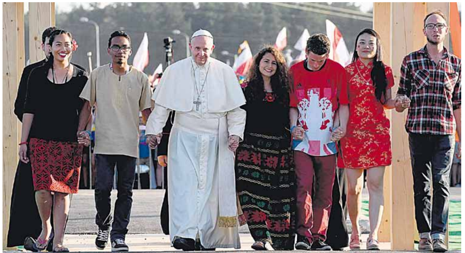
Para el papa Francisco, la vida comunitaria –que supera fronteras– es una clave de la pastoral juvenil.

“¿Qué dice la palabra de Dios sobre los jóvenes?”. La respuesta de Francisco recorre el Antiguo Testamento y recuerda figuras como Gedeón, Samuel, el Rey David, Jeremías, Rut. Sin embargo, cita el Nuevo Testamento para plantear: “El que es mayor entre vosotros, se hace como el más joven”