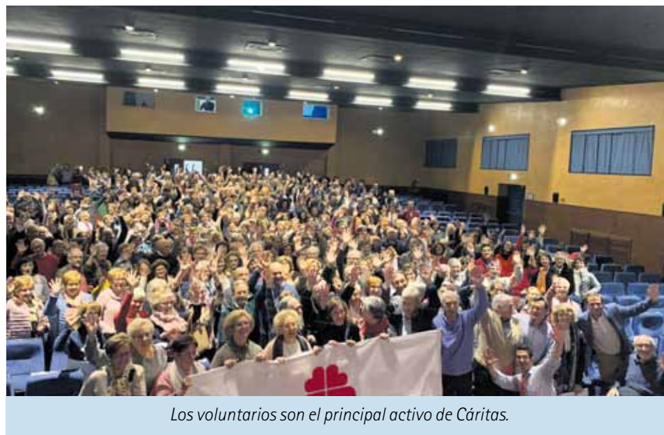
Los voluntarios son el principal activo de Cáritas.

Tras un tiempo de diálogo y un breve descanso, la jornada continuó a las 12.30 con la parte más práctica. En concreto, se desarrollaron de forma simultánea doce seminarios