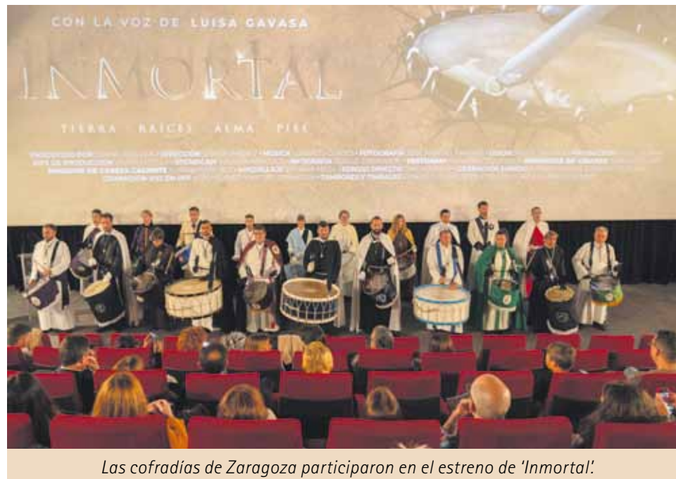
Las cofradías de Zaragoza participaron en el estreno de 'Inmortal'.