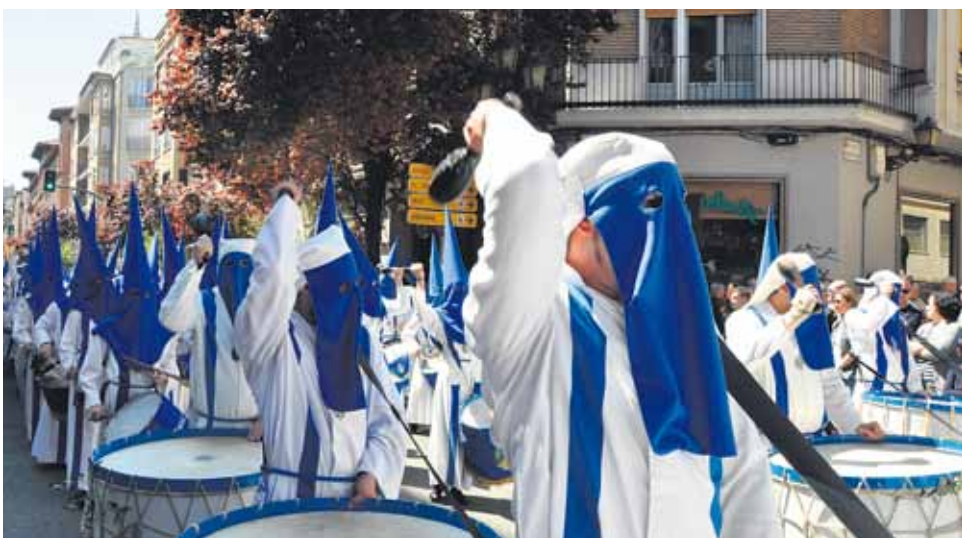
El toque de los tambores y bombos expresa el misterio de la muerte de Dios.

Cristo es también cabeza de la Iglesia, en la cual todos somos miembros de un cuerpo único, que por eso se define como "comunión de los santos", comunidad de realidades santificantes y de hombres llamados a la santidad (Rom 8, 29; Col 1, 15-18; Ap 1, 5; Rom 8, 16-17; 2 Cor 3, 18; 1 Cor 15, 49; Ef 4, 15; 1 Cor 12; Rom 12; 1 Cor 6, 15; Ef 4, 25; 5, 30).