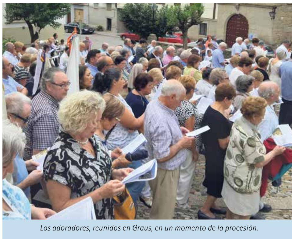
Los adoradores, reunidos en Graus, en un momento de la procesión.