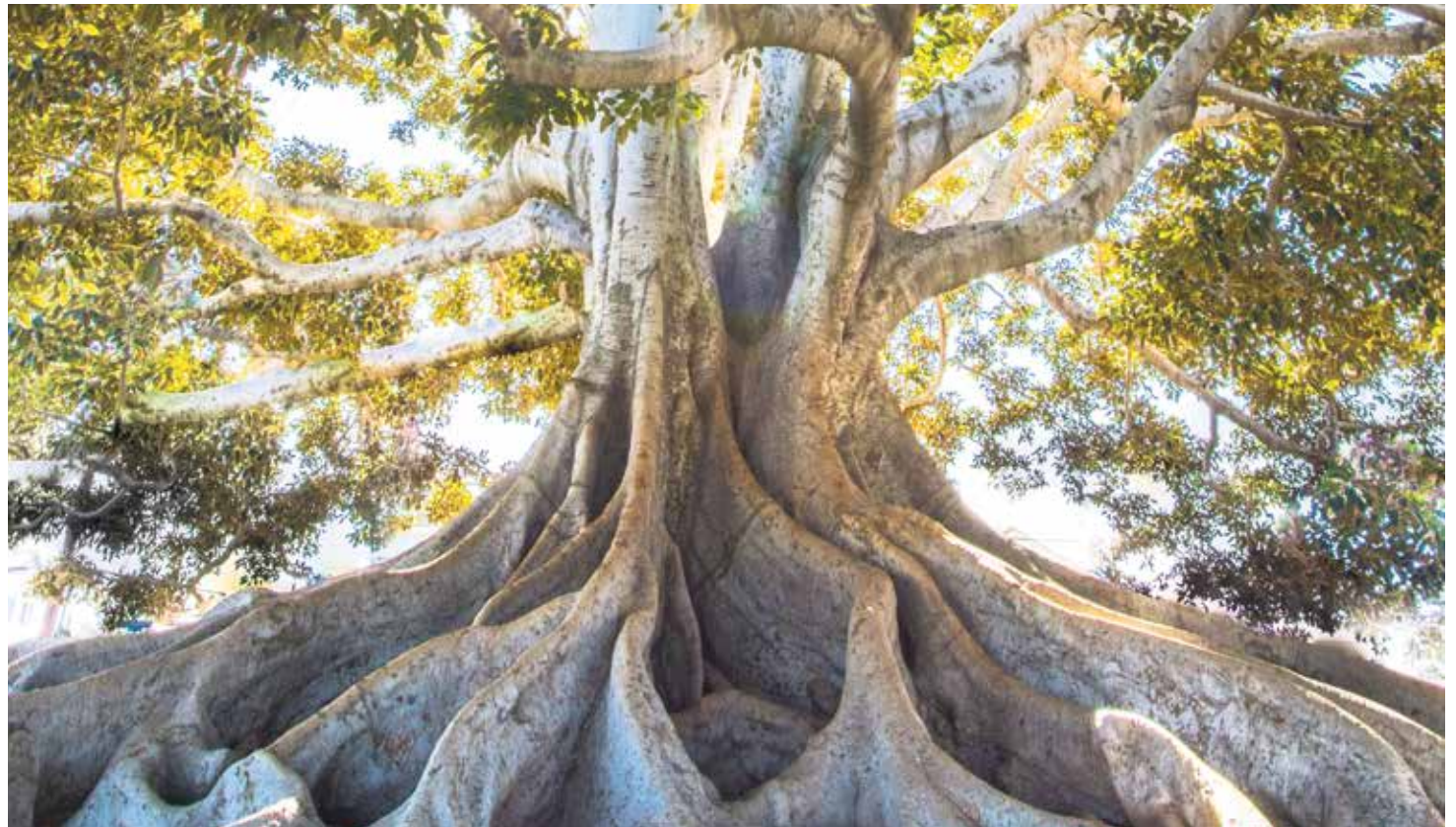
En una persona madura, la razón y la voluntad gobiernan sobre los sentimientos y los estados de ánimo.

El carácter es como un buen bistec: sólido y sustancial. Los sentimientos son solo un aderezo. Es preciso mantenerlos en su lugar. Los sentimientos dependen de los estados anímicos, de las impresiones y de las sensaciones; el carácter se basa en principios y en una voluntad firme. Los niños suelen dejarse llevar por sus sentimientos y deseos del momento. No necesitan oír: «Si te gusta, hazlo», pues les brota espontáneo. El sentimiento y la espontaneidad llevan la voz de mando.