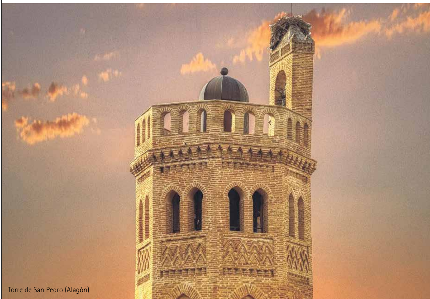
Torre de San Pedro (Alagón)

Alagón celebra sus primeras 'Jornadas Musicológicas' en honor al sacerdote y compositor Miguel Arnaudas, en el 150 aniversario de su nacimiento. Pág. 7