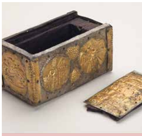
Lipsanoteca de San Juan de la Peña.

Prerrománico, principios del siglo X. Madera tallada y latón plateado y sobredorado. Procede del monasterio de San Juan de la Peña