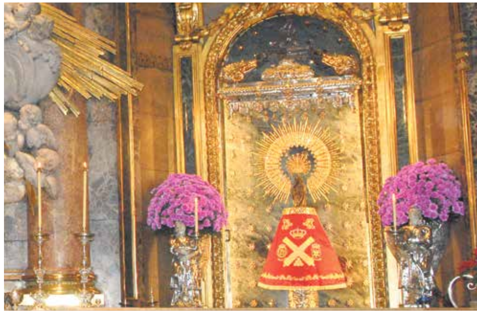
En la Santa Capilla se concentra la piedad, el culto y la devoción del pueblo a la Virgen.

El templo es auténtico cenáculo, donde todas las categorías de fieles tienen la gozosa posibilidad de sumergirse en la oración junto con María, la Madre de Jesús, no sólo mediante la plegaria litúrgica, sino también mediante esas sanas formas de piedad popular, que no pocas veces manifiestan el genio religioso de todo un pueblo, llegando en ocasiones a una impresionante agudeza teológica, junto a una extraordinaria inspiración estética y poética.