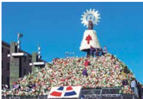
Ofrenda de Flores en 2013.

Este año 2019 se han inscrito un total de 803 grupos para la Ofrenda de Flores a la Virgen del Pilar, 28 más que el año pasado.