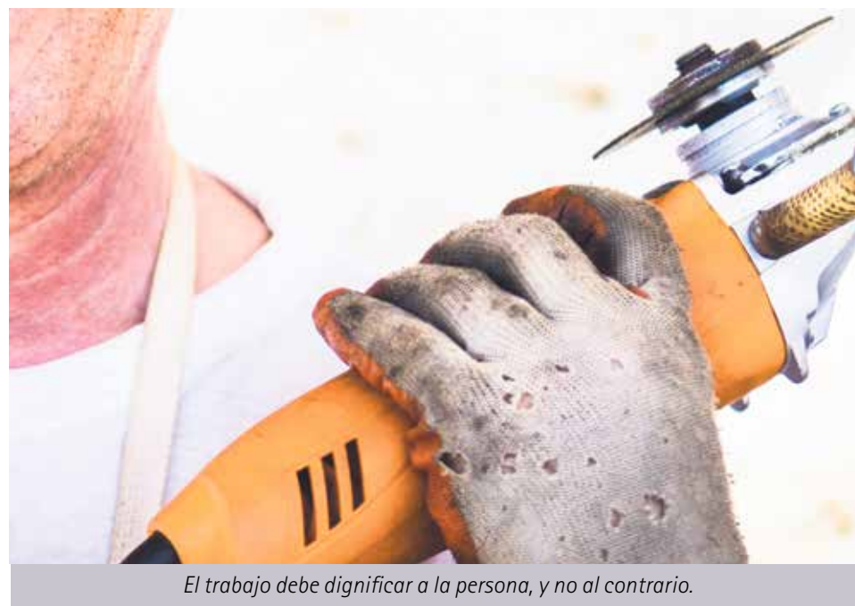
El trabajo debe dignificar a la persona, y no al contrario.

El trabajo decente no solo garantiza ingresos suficientes, sino que permite el crecimiento personal, la contribución al bien común y el avance de la sociedad.