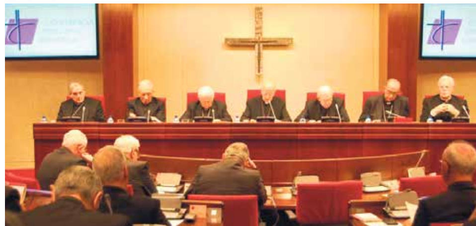
Plenaria de la Conferencia Episcopal Española

La Conferencia Episcopal Española (CEE) ha actualizado su web institucional presentando una página más accesible, cercana y visual. El objetivo es que el nuevo diseño permita a los usuarios acceder de forma sencilla a las actividades diarias de la CEE desde cualquier dispositivo: ordenador, móvil o tablets.