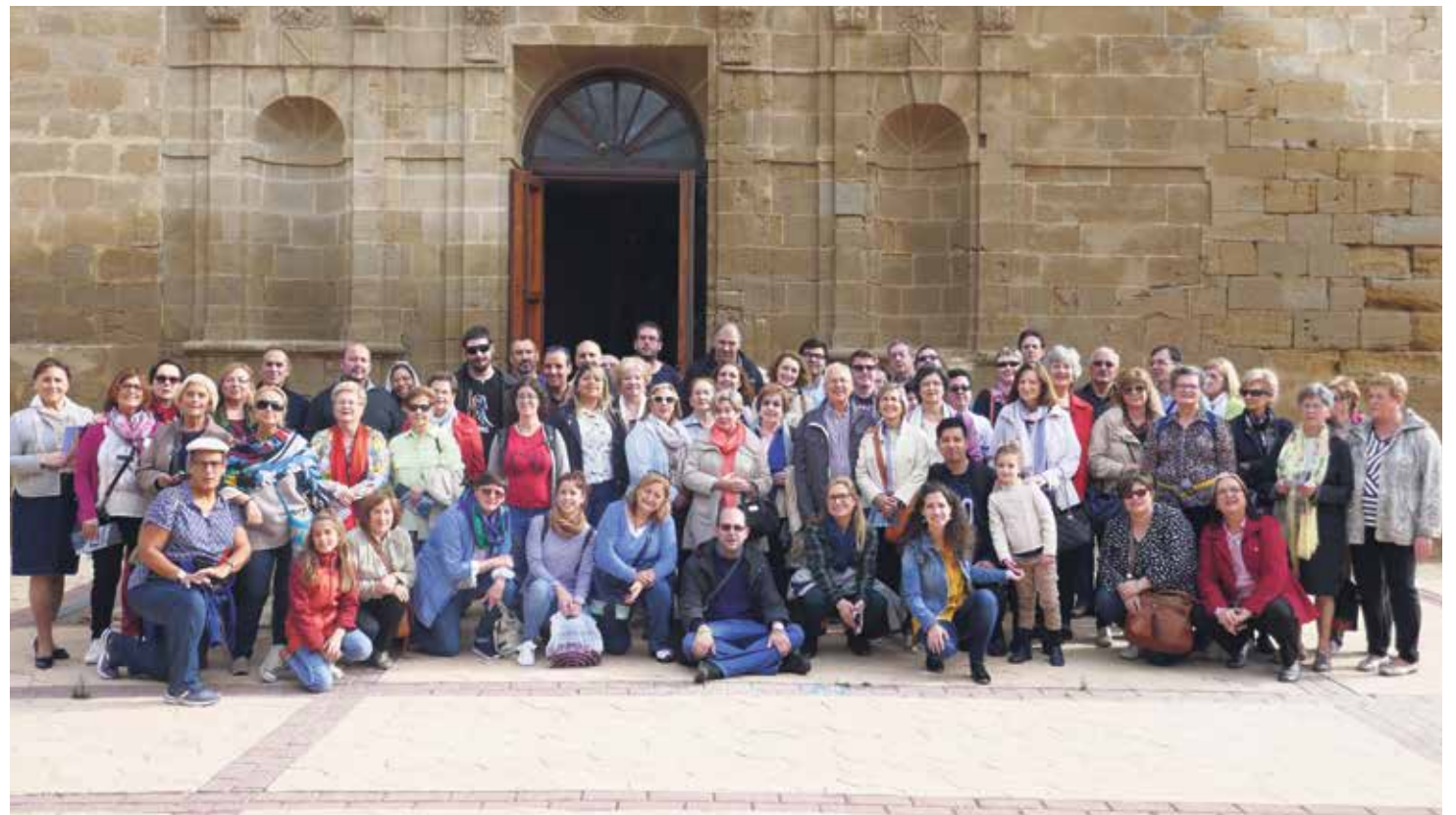
Catequistas de Aragón que participaron en el curso de Peralta de la Sal celebrado en julio de este año.

Inscripciones en las Delegaciones Diocesanas de Catequesis.