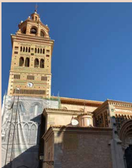
La torre de la Catedral luce su mejor cara.

La segunda fase ha sido desarrollada por los arquitectos Joaquín Andrés Rubio y José María Sanz Zaragoza y ha servido para actuar sobre el cuerpo intermedio de la torre de la catedral. Los trabajos continuaban la labor de la primera fase, realizada en 2017 con cargo al FITE 2016, que sirvió para actuar fundamentalmente en la parte superior de la torre y su remate barroco.