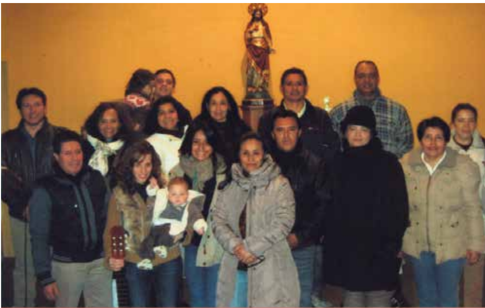
Misa y Encuentro con Migrantes en Jaca.

Segundo domingo de mes, de 10 a 12 horas, en la Casa Diocesana, Santa Misa y meditación.