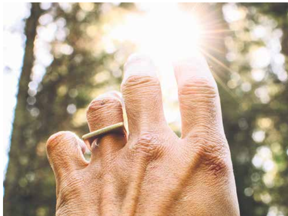
Dudar de la naturaleza divina de Jesús reduce a Cristo a un maestro espiritual más.

En relación con la doble naturaleza de la única persona divina del Verbo, algunos autores han cuestionado el carácter absolutamente singular del acontecimiento de la Encarnación del Hijo de Dios, interpretando este hecho histórico-salvífico como un símbolo de la presencia de Dios en todo ser humano. Jesús de Nazaret no sería el Hijo único de Dios hecho hombre en la plenitud de los tiempos, sino alguien en quien se habría dado