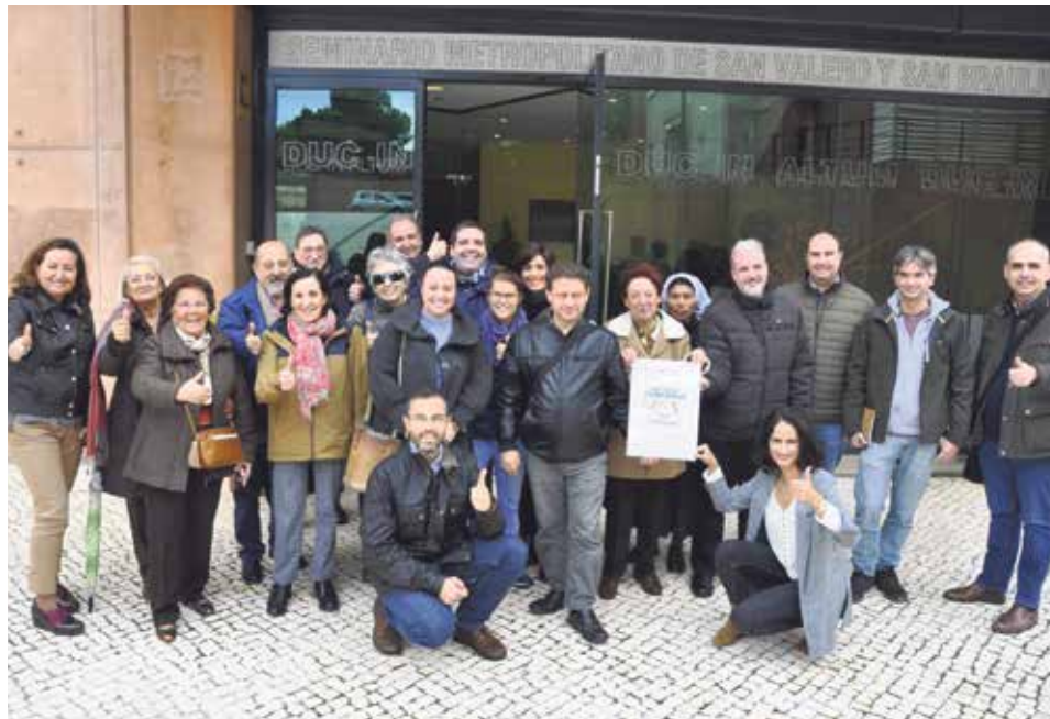
El Churchcom de 2018 permitió crear un equipo de voluntarios digitales.

La delegación episcopal de Comunicación de Zaragoza ha preparado una nueva edición de la jornada 'Churchcom', dirigida especialmente a las delegaciones de la diócesis. Esta jornada tendrá lugar el sábado nueve de noviembre en el Seminario Metropolitano de Zaragoza. El propósito del encuentro es ayudar a 'Comunicar con eficacia', como reza su lema.