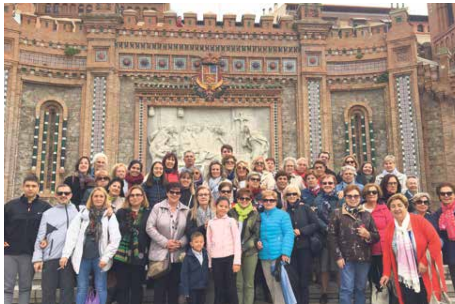
Los catequistas de Aragón compartieron una jornada llena de alegría.

Al finalizar la oración se presentaron el cartel y material de formación de este curso para todos los catequistas de Aragón, así como el primer catecismo de la Conferencia Episcopal Española. El lema de este año, 'Eso que hemos visto y oído os lo anunciamos', va acompañado del símbolo de una regadera. Si no la llenamos de agua, no podremos regar, invitación a vivir en relación con el Señor para poder ser evangelizadores.