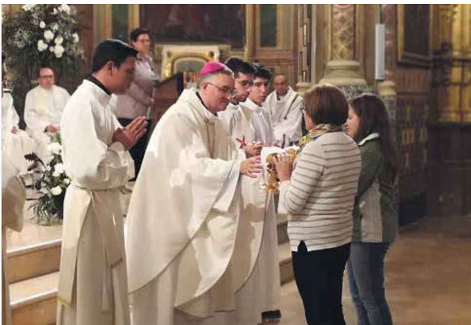
Un momento de la celebración que tuvo lugar en la iglesia de San Pedro.

Seguidamente se hicieron dos grupos para realizar diversos recorridos por la preciosa ciudad de Teruel. Todas las visitas fueron muy interesantes y nos ayudaron a conocer esta ciudad tan hermosa e importante en la historia.