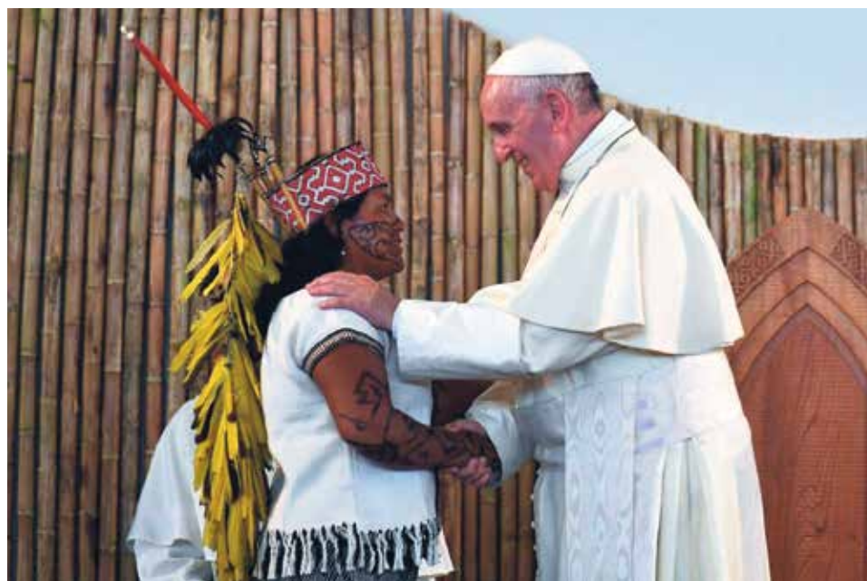
Promover la Amazonia no significa “colonizarla culturalmente”.

En este sentido, el Papa destaca que “un verdadero planteo ecológico” es también un “planteo social” y, si bien aprecia el “buen vivir” de los indígenas, advierte contra el “conservacionismo” que solo se preocupa por el medioambiente. En tonos vibrantes, habla de “injusticia y crimen”. Recuerda que Benedicto XVI ya había denunciado “la devastación ambiental de la Amazonia”. Los pueblos originarios, advierte, sufren el “sometimiento” tanto de los poderes