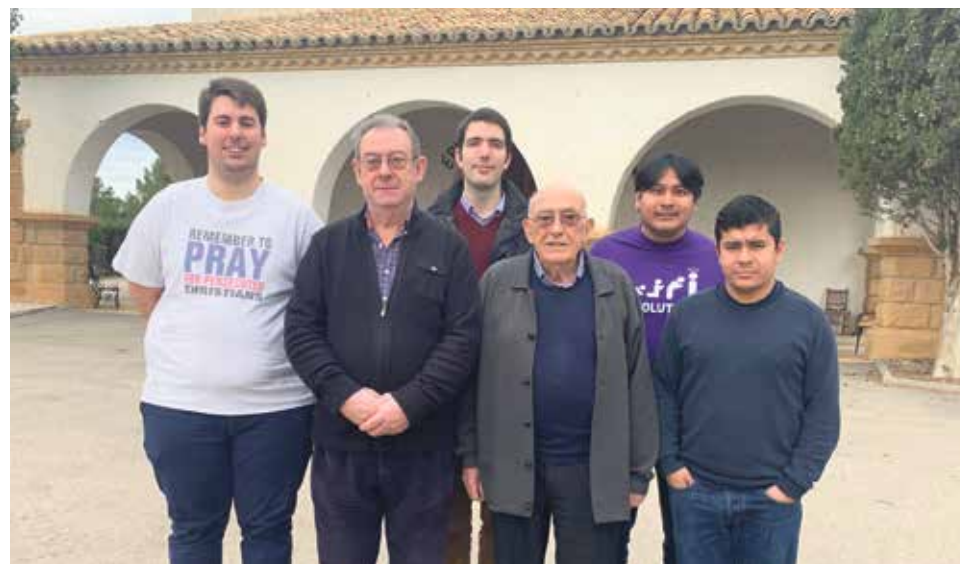
Los próximos diáconos durante sus ejercicios espirituales en Híjar.

Además, desde el primer domingo de Cuaresma, realizaron una semana de ejercicios espirituales en la casa 'Nuestra Señora del Carmen' de Híjar, ultimando su preparación para su inminente ordenación como diáconos. Durante estos días respondieron a 'Iglesia en Aragón' a tres preguntas. Estas son sus respuestas.