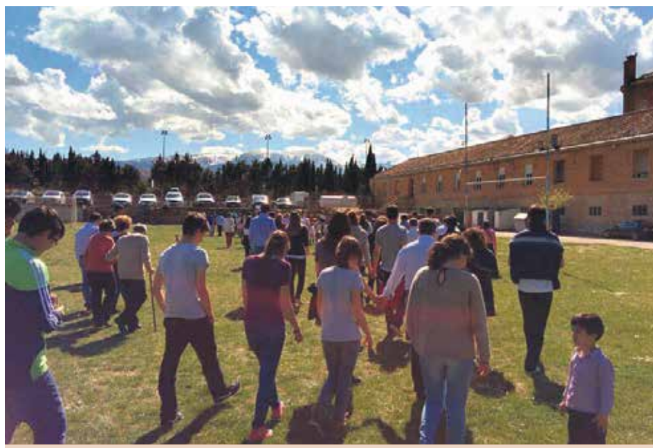
Las familias enteras participan de los ejercicios espirituales familiares.