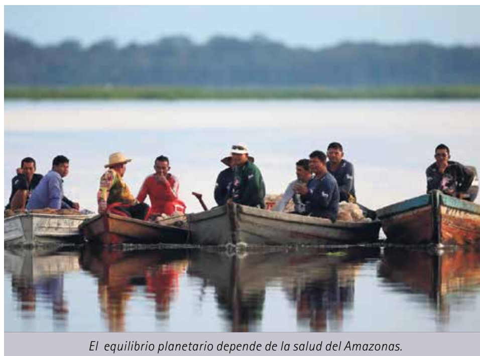
El equilibrio planetario depende de la salud del Amazonas.

En el número anterior, se recogía el sueño social, cultural y ecológico que el papa Francisco comparte en la exhortación apostólica postsinodal 'Querida Amazonia'. En esta tercera entrega, se concluye la síntesis del documento con el sueño eclesial y el llamamiento, una vez más, a que el desarrollo sea auténtico y sostenible.