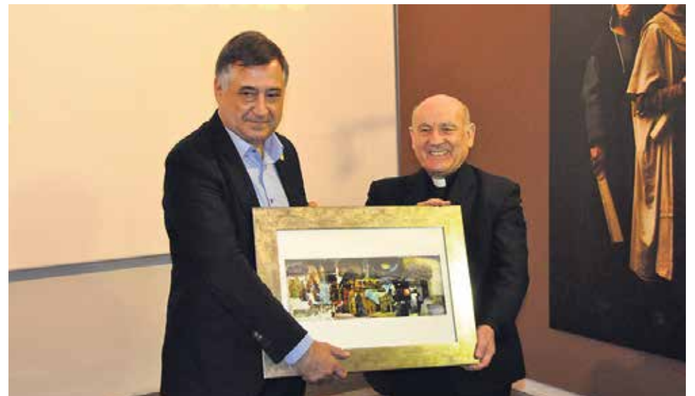
El Arzobispo entrega el galardón a Gervasio Sánchez.

El jurado decidió otorgar este galardón a Gervasio Sánchez por su «ejemplar y dilatada» trayectoria profesional, en la que, con una "mirada rigurosa, humilde, honesta y comprometida, ha denunciado realidades silenciadas, ha puesto voz y rostro a miles de víctimas indefensas y ha brindado un seguimiento a sus trabajados difícil de encontrar en el sector, ya que ha vuelto –y vuelve– al lugar de los acontecimientos décadas después, poniendo incluso en riesgo su propia vida".