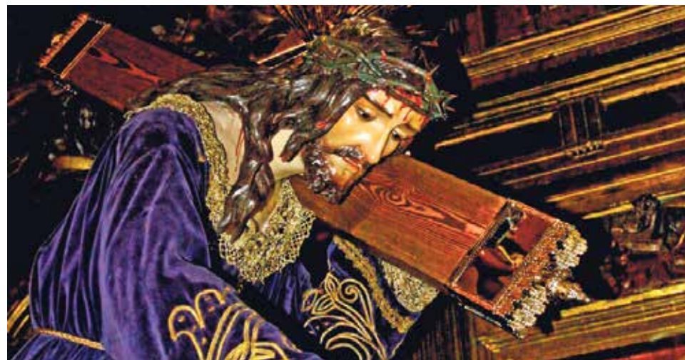
Nuestro Padre Jesús el Nazareno.

El viernes 6 de marzo la Cofradía Nuestro Padre Jesús Nazareno de Jaca organizó la tradicional celebración del "El Primer Viernes de Marzo". Acto que celebran las Cofradías Nazarenas en esta fecha