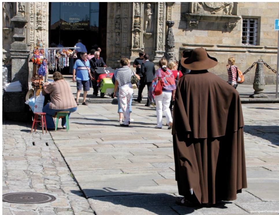
Santiago de Compostela.

La iglesia compostelana tiene el orgullo de tener un origen apostólico pues nació en torno a la tumba del apóstol Santiago. De ahí que sienta una especial cercanía a la persona y a la predicación original de los apóstoles.