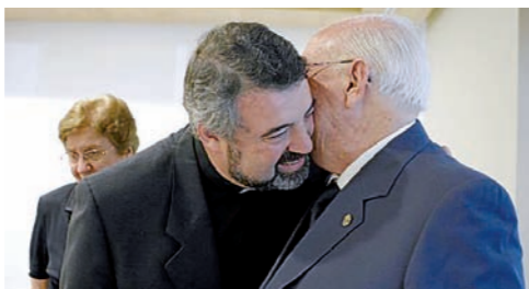
Con sus padres. Para el nuevo Obispo de Teruel y Albarracín, "la familia es motor de evangelización".

Queridos sacerdotes os saludo con especial afecto. La Iglesia nos urge a llevar adelante la evangelización en este tercer milenio recién estrenado. Nuestra respuesta ilusionada y fraterna a tan gran encomienda, debe llenar de esperanza a las gentes de la diócesis a la que servimos. Con el eco en el corazón del Año Sacerdotal recientemente clausurado os animo a vivir el ministerio que el Señor nos ha confiado con espíritu de renovación interior constante. Que el corazón de nuestro presbiterio y de nuestra diócesis sea profundamente eucarístico.