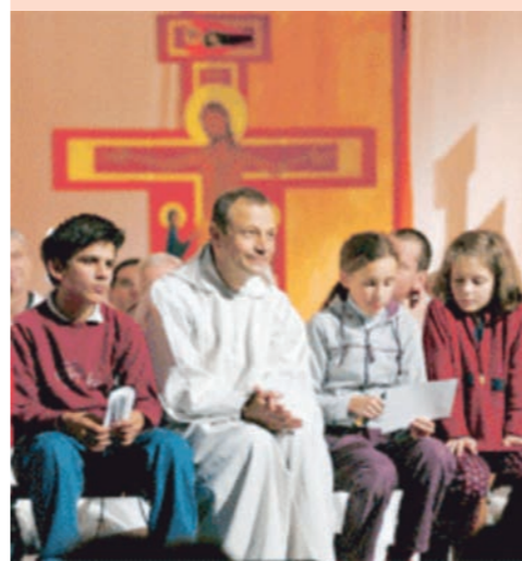
El hermano Alois, actual prior de Taizé.

La comunidad de Taizé no ha dejado de trabajar en estos años a favor de la reconciliación entre las Iglesias y los pueblos y ha repetido una y mil veces su confianza en las nuevas generaciones.