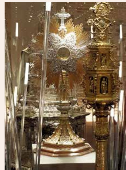
Custodia de los Condes de Argillo.

El desarrollo de los recursos digitales en www.almamatermuseum.com se ha enriquecido con el apartado 'Prepara tu visita' y la sección 'Aprende divirtiéndote'. Además, para visitar el museo garantizando la seguridad de sus visitantes, se han cambiado las hojas de sala por códigos QR y se recomienda reservar previamente la visita a través del teléfono 976399488 o el correo info@almamatermuseum.com