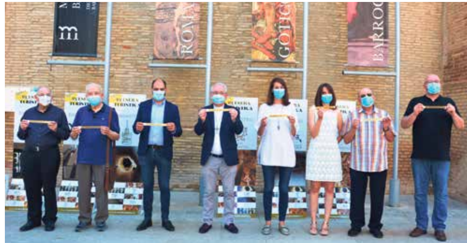
La pulsera servirá para visitar seis monumentos locales.

La Pulsera Turística da derecho a visitar los monumentos cuantas veces se desee ya que es un bono que no caduca, reutilizable mientras la pulsera permanezca en la muñeca. Tiene un precio de 8 euros, es gratis para los niños de hasta 11 años inclusive y, gracias a la colaboración del Ayuntamiento de Barbastro, los vecinos empadronados en la ciudad dispondrán de una pulsera gratuita