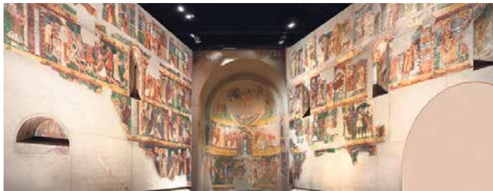
Pinturas de Bagüés.

Románico, finales del s. XI – principios del s. XII. Pintura al fresco arrancada y traspasada a lienzo