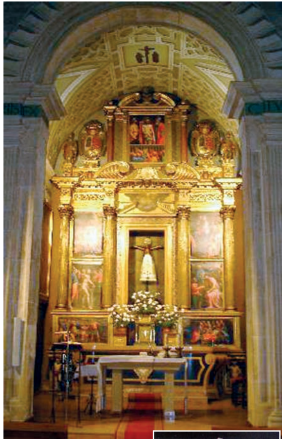
Capilla del Santo Cristo de los Milagros. Catedral de Huesca.

Que sepamos recuperar las raíces de una herencia de siglos y valorar todo el bien que puede aportar a la sociedad. Para ello hemos de comenzar por sentir el orgullo y la alegría de ser cristianos.