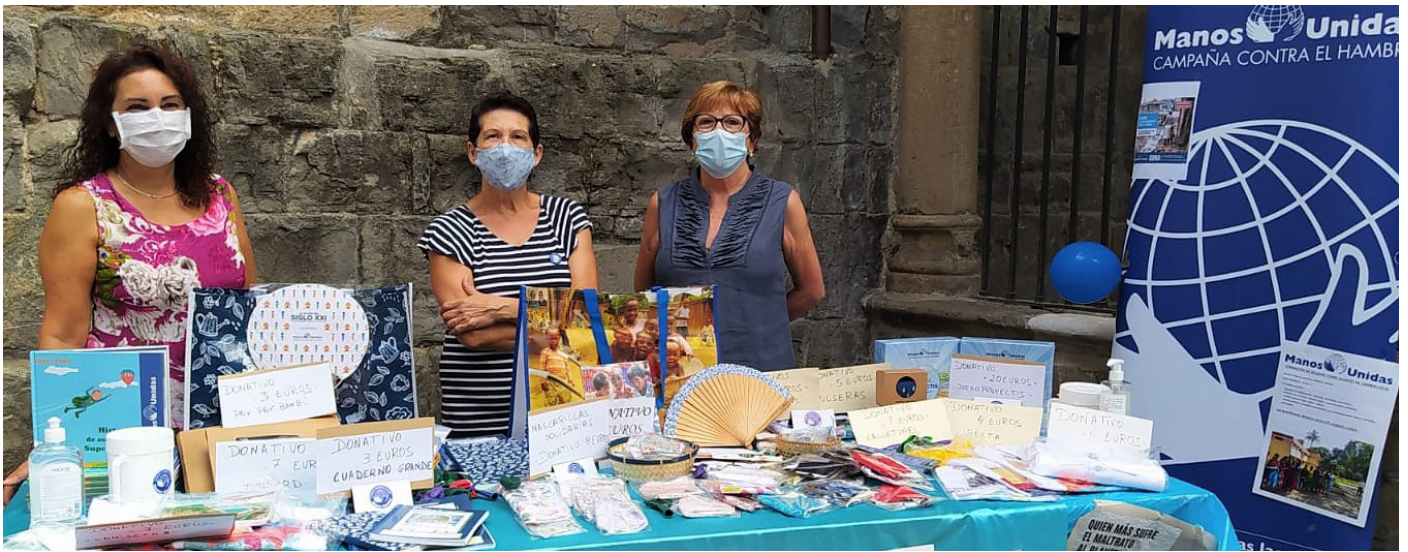
Manos Unidas Jaca en la Plaza de la Catedral.